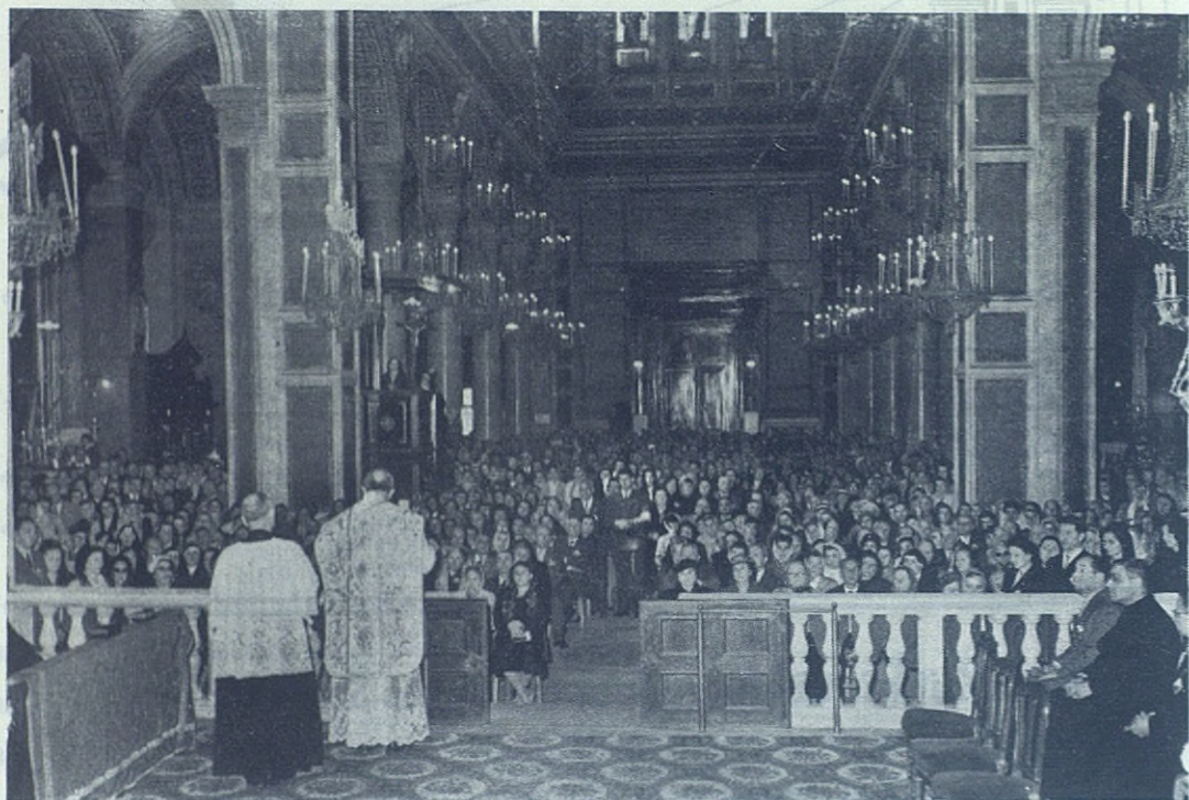
ROMA.—El Rvdo. Rector Mayor hablando a los Cooperadores Salesianos.

La gracia tiene el poder de santificarnos en cualquier edad, en cualquier estado, en cualquier condición, aun en medio del mundo: basta que nosotros nos prestemos, conformando nuestra conducta con los ejemplos y las enseñanzas de Jesús.