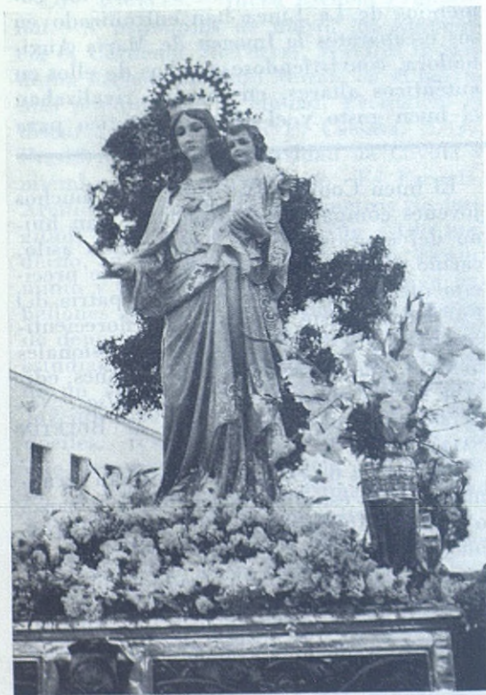
LA LINEA DE LA CONCEPCION. —Hermosa imagen de María Auxiliadora que por primera vez recorrió las calles de la ciudad

A las 9'30 tuvo lugar la solemne función: