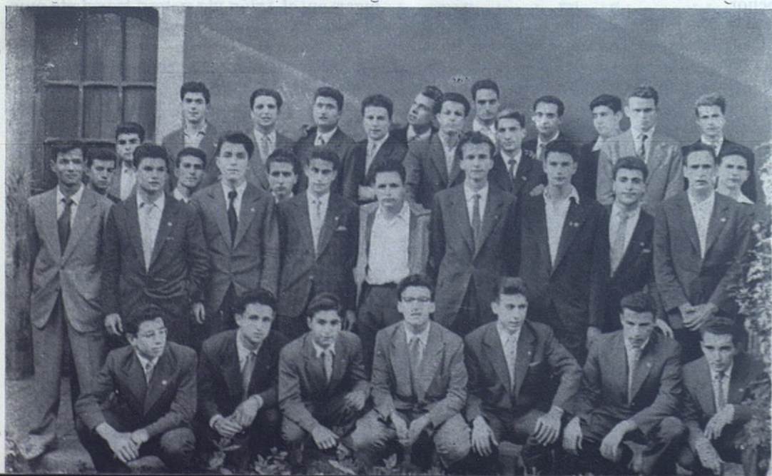
BARCELONA-SARRIA. —Alumnos que el próximo pasado mes de junio han terminado sus estudios profesionales.

patria y también en las misiones. En el día de vuestro cincuentenario estaré presente espiritualmente y con mis oraciones... mientras os auguro que esa Casa continúe sus gloriosas tradiciones, siendo para todos faro de buen ejemplo y de perfecta vida salesiana.»