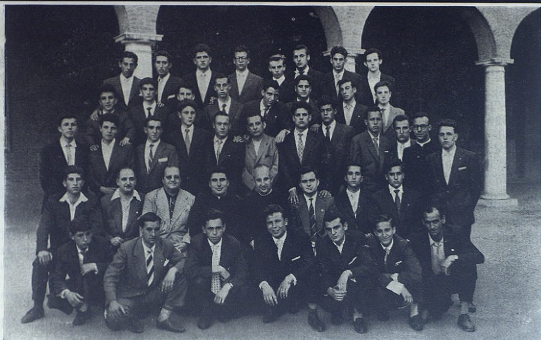
MADRID-ATOCHA. —Grupo de alumnos que terminaron felizmente sus estudios, obteniendo el título de Maestro Industrial.

Mayor don Renato Ziggiotti, que con fecha de 5 de julio envió su adhesión a las fiestas jubilares: