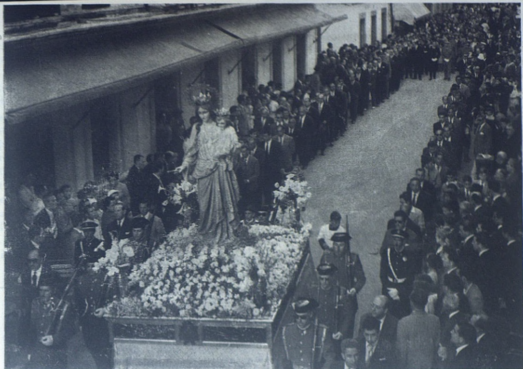
LA LINEA DE LA CONCEPCION. —La primera procesión de María Auxiliadora celebrada en la ciudad.

cían cánticos grabados de la Schola Cantorum del Colegio, y se dirigían las oraciones.