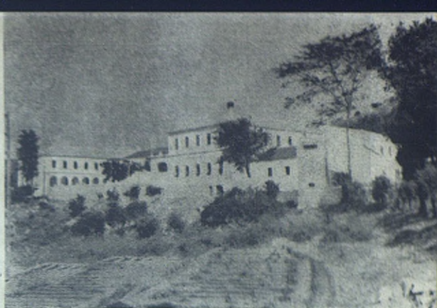
SAN JOSE DEL VALLE (Cádiz).—Vista general de la Casa.

Nos acompañaron, durante el día, salesianos de diversas Casas, entre ellas la del