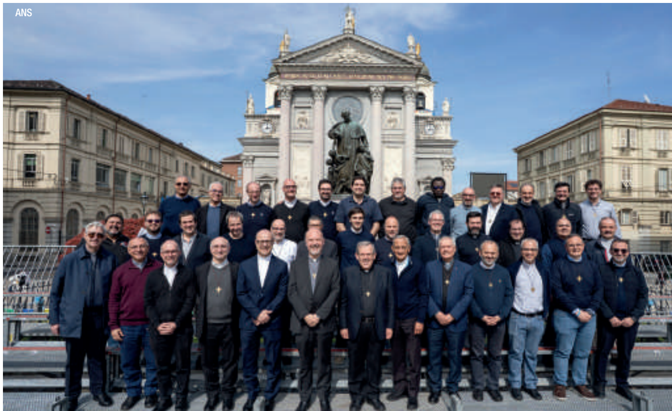
Foto de familia de los capitulares participantes de la Región Mediterránea junto al Rector Mayor, Fabio Attard.