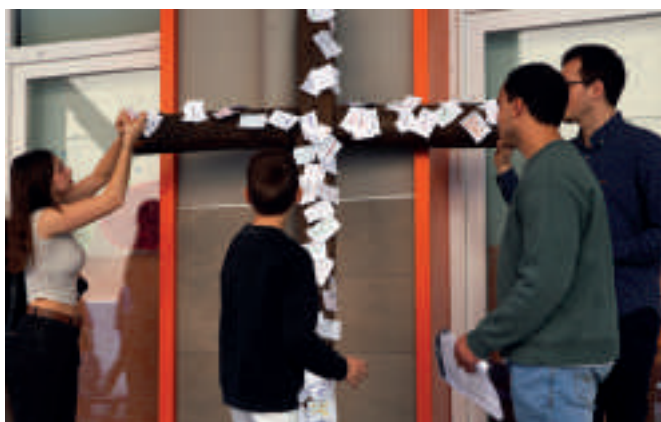
En la Pascua de adultos celebrada en Salesianos San Antonio Abad de Valencia, los participantes clavaban en la cruz sus deseos e intenciones.