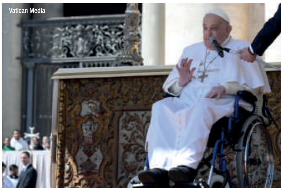
El papa Francisco saludó a los peregrinos del Jubileo de los Enfermos y mundo de la Sanidad al finalizar la misa del domingo 6 de abril.