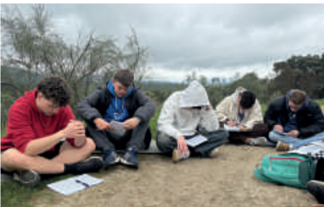
Tiempo interior en la Pascua Salesiana de Nivel 2 de La Adrada, de la Inspección Santiago el Mayor.