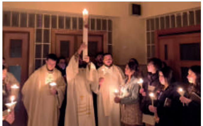
La luz del cirio pascual ilumina a los jóvenes participantes en la Vigilia del Sábado Santo en la Pascua de Nivel 1 celebrada en Arévalo.