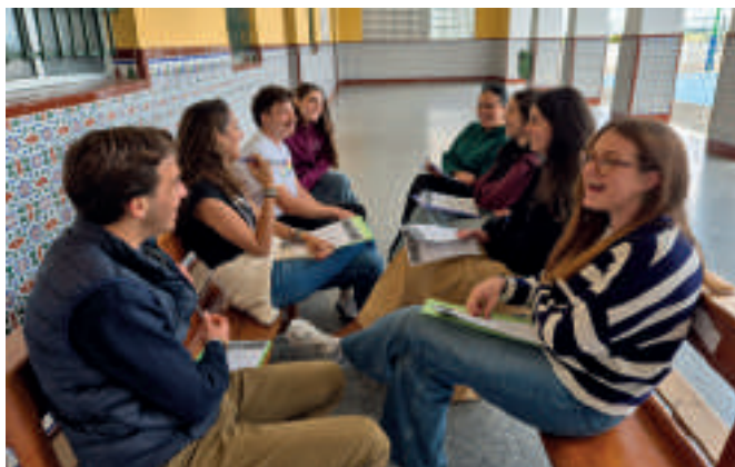
Pascua Salesiana en San José del Valle. En las reuniones hay tiempo para compartir la fe.