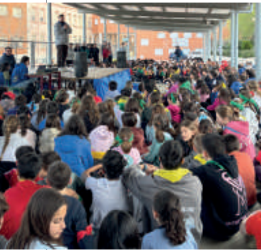
“Queremos ayudarTe”, lema en el encuentro de Chiquis 2025 de la Federación Valdoco, celebrado en Aranjuez, con 650 participantes.

Estos encuentros juveniles llenaron los patios de estas cuatro presencias salesianas en España. Los lemas que guiaron estas jornadas juveniles fueron “Queremos ayudarTe”, “Peregrinos del futuro” y “Viajando al futuro”.