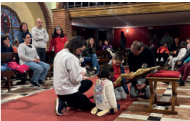
También la Pascua Salesiana se vivió entre las familias. Adoración a la cruz en la pascua vivida en Mohernando.