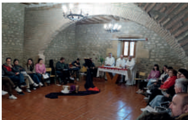
Pascua Salesiana de jóvenes y familias en Somalo. Celebración de los Oficios el Jueves Santo.