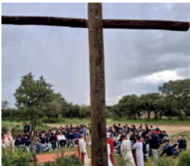
Pascua de Nivel 3 en Mohernando. La cruz fue la protagonista en el Viernes Santo.