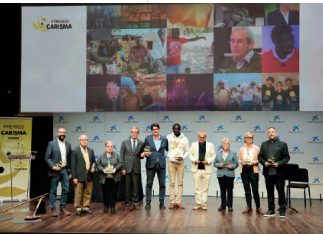
Un momento de la entrega de premios de la edición de 2024.