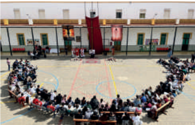
Momento común de encuentro en la Pascua Salesiana vivida en Antequera.