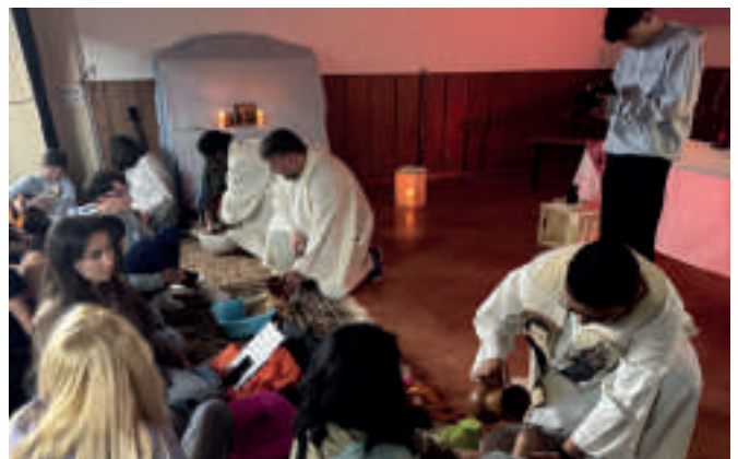
Lavatorio de pies en las celebraciones litúrgicas del Jueves Santo. Pascua Salesiana celebrada en Cataluña.