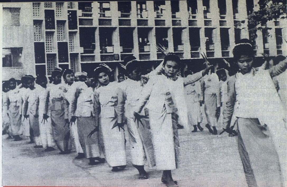
HAAD-YAI - TAILANDIA. —En Oriente tienen gran importancia las manifestaciones folklóricas y gimnásticas, como prueba de la bondad de la enseñanza de los Colegios. Los Salesianos, como es lógico, no descuidan este aspecto y organizan todos los años diversos festivales con los alumnos de las escuelas católicas. La foto nos muestra las alumnas de las Hijas de María Auxiliadora exhibiéndose con delicado arte en una danza oriental; nótese los extraños guantes de dedos puntiagudos para dar mayor expresión a los movimientos.

en la cruz perdonó a todos y nosotros hemos de hacer otro tanto”.