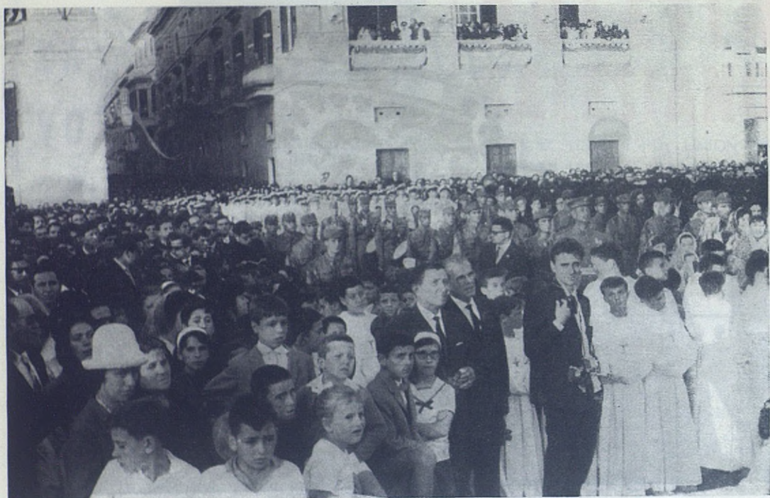
CIUDADELA.—La coronación de la imagen de María Auxiliadora constituyó un acontecimiento religioso de primera magnitud en toda Menorca; lo prueba la muchedumbre que se volcó en la plaza del Borne. Asistieron todos los alcaldes de la isla, las autoridades civiles y militares y representantes de las máximas autoridades de las Baleares. Una compañía de marinería le rindió honores. Las bandas de música del Regimiento de Mahón y de los Higares Ana G, de Mundet de Barcelona realzaron los actos religiosos y amenizaron los profanos.

Concedida benignamente por la Santa Sede y delegado en su Obispo el cumplimiento de la sagrada ceremonia de la coronación. Ciudadela se preparó enfervorizada para el grande acontecimiento.