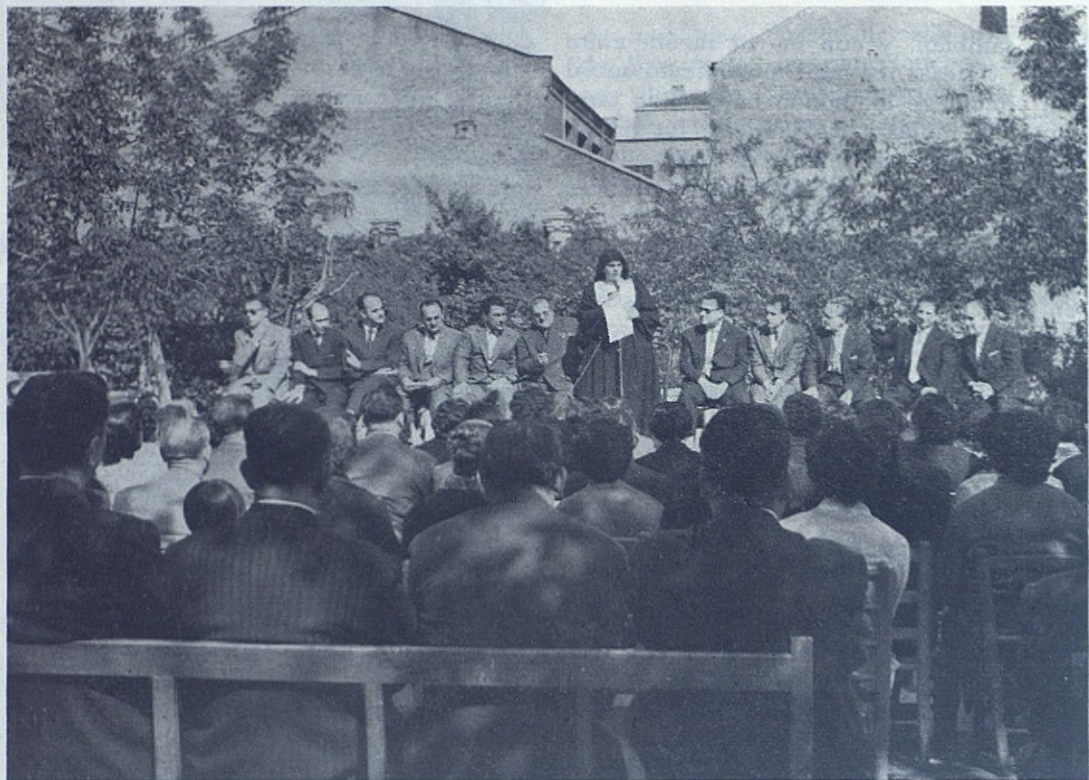
MADRID (Delicias).—La señora Directora del Colegio saluda a los asistentes al solemne acto que tuvo lugar el día de la Virgen del Pilar.

Deportiva, de Vestido y asuntos femeninos. Naturalmente, el Círculo se compone de padres y madres, y así también la Junta Directiva.