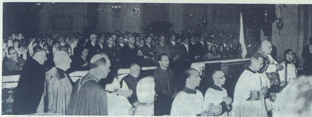
CASTEL GANDOLFO (Italia).—El Santo Padre celebra la Santa Misa en la parroquia salesiana.

das gracias y le presentó el homenaje de toda la Congregación, a lo que él correspondió con palabras de admiración y elogio a la Obra Salesiana, cuya múltiple actividad, dijo, ha constatado en diversas partes del mundo.