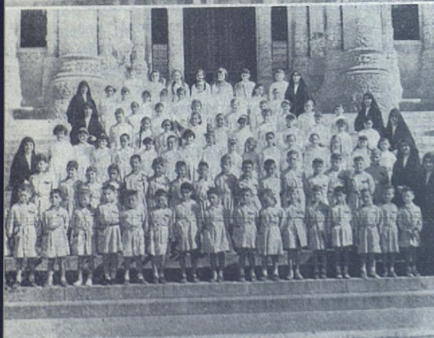
BARCELONA. —Las Hijas de María Auxiliadoras en el Tibidabo. De arriba abajo: