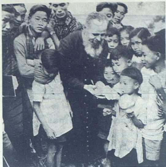
MANIPUR (India).—Misión Salesiana. El misterio de Dios hecho Hombre, maravilla y conmueve a los neófitos grandes y pequeños.

biar el nombre de la isla y bautizarla con el nombre de «Don Bosco».