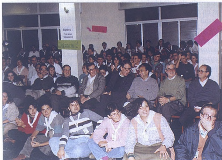
Danza de los jóvenes.

Algo importante debe suceder cuando todos rien.