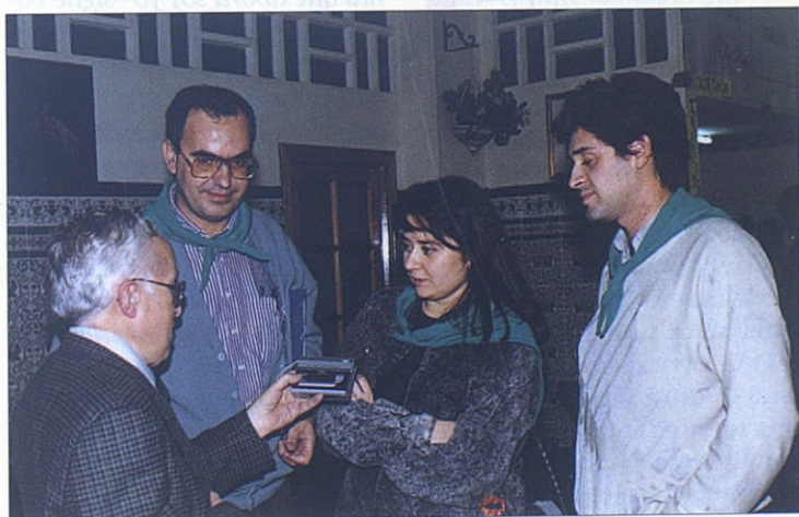
El autor del artículo conversa con salesianos y jóvenes.

—La coordinación la lleva la Delegación nacional de PJ, mediante un coordinador Nacio-