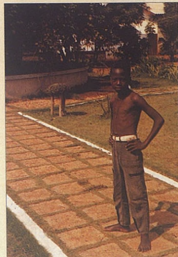
Joven en espera de ser también un día novicio.

la sociedad. Procuero insistirles en que deben comprender y asumir las exigencias de su formación completa: hacerse salesiano es un compromiso: no es ir a cazar mariposas o a jugar al fútbol; han de adquirir convicciones y seguridad profundas para armonizar el carisma salesiano y su identidad africana. Es un punto muy exigente pues conlleva la educación de la libertad cuando, generalmente, han sido educados para la sumisión o para el despotismo.