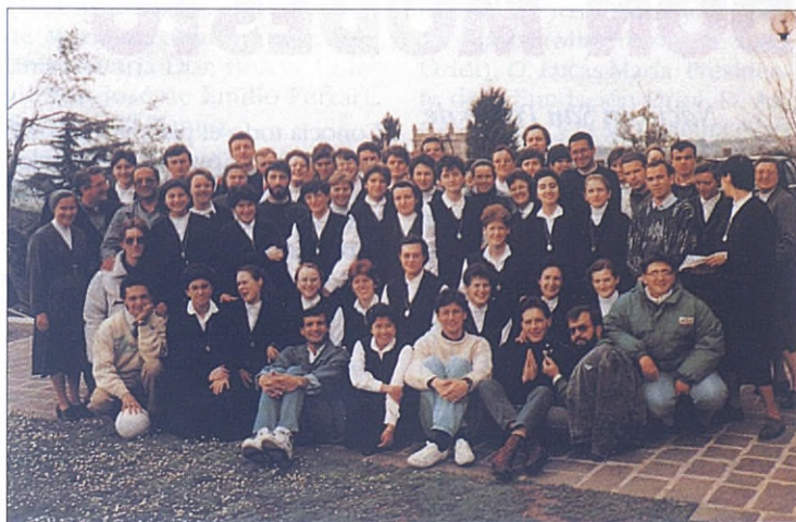
Castelgandolfo (Roma). Las novicias salesianas de Roma y los novicios salesianos en un encuentro de estudio y convivencia.

La respuesta no se hizo esperar. Durante un día entero la colina de Rakovnik en la periferia de la ciudad se transformó en un verdadero hormi-