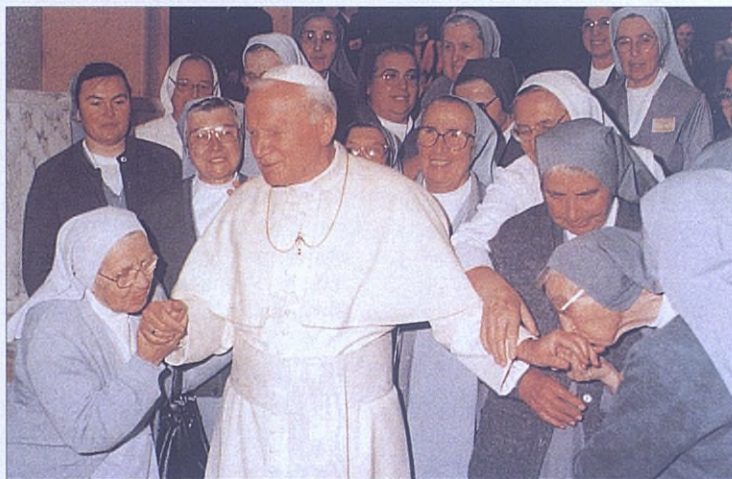
Roma: El Santo Padre con un grupo de misioneras salesianas que han participado en un curso de actualización celebrado en Roma.

minicana). ANS. "El Documento de Santo Domingo y sus instancias para el ejercicio de nuestra misión" ha sido el tema más destacado de la "visita de conjunto" a la Región Pacífico-Caribe, que tuvo lugar en Santo Domingo del 26 de septiembre al 2 de octubre. Otros temas de estudio y debate fueron: La preparación de los salesianos durante su formación inicial y en la formación permanente, y el "proyecto seculares" en las comunidades y en la Familia Salesiana. Asistieron el Rector Mayor y cinco