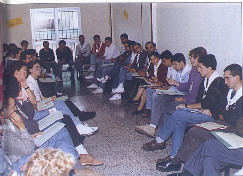
Momentos de alegría comunicativa y de reflexión en grupo.

—La infraestructura y el montaje en cada encuentro corre por cuenta de la Inspectoría de Córdoba.