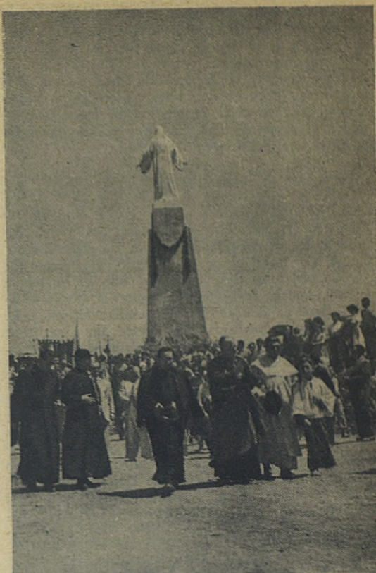
MONZON.—El monumento al Sagrado Corazón de Jesús, recientemente inaugurado

lo Cielos es un rayo más de luz sobre la realidad cial la Redención y de la predestinación eterna. las groseras aberraciones del materialismo y reinvin- trid y de materia, nuestra dignidad de criaturas e a resurrección de los cuerpos, la condenación eterna fiel que viven en la Iglesia conforme al Evangelio.