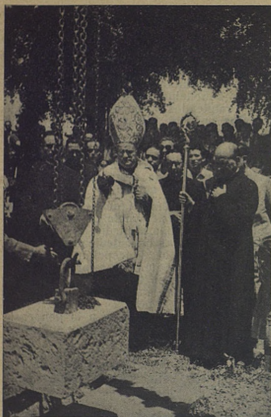
MONZON. —Bendición de la primera piedra de las Escuelas Profesionales Salesianas

tísimo y reverendísimo señor Obispo de la diócesis, de quien leyó un telegrama el reverendo don Francisco Javier Montero, salesiano encargado de la nueva fundación. El telegrama retransmitía otro recibido de S. S. el Papa, en el cual bendecía a los muníficos fundadores, al clero y a los habitantes de la villa.