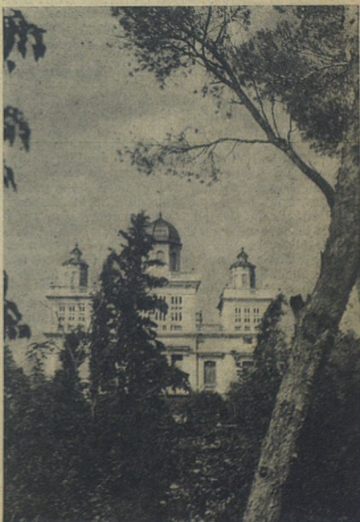
ARBOS DEL PANADES (Tarragona).—El Noviciado de la Inspectoría Salesiana Tarragonense, recientemente inaugurado.