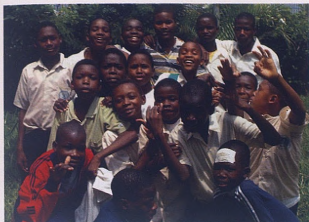
Los niños se divierten y aprenden con sus compañeros

personalidad, pero son como por-dioseras de la sociedad, como si tuvieran que pedir un sitio en ella.