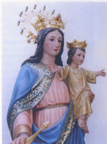
Imagen de María Auxiliadora. Colegio Hogar Caixanova Vigo

Por gracias recibidas de María Auxiliadora , envío donativo para el Boletín Salesiano . Una devota .