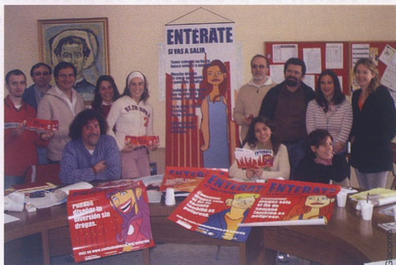
La Federación de CJ Don Bosco de Castilla y León desarrolla la Campaña en la autonomía castellana y leonesa

La campaña "Entérate" en su vertiente informativa tiene implícita una filosofía sobre la necesaria interacción destinatarios-mediadores para cumplir sus finalidades. Entendemos que la clave para disminuir el daño