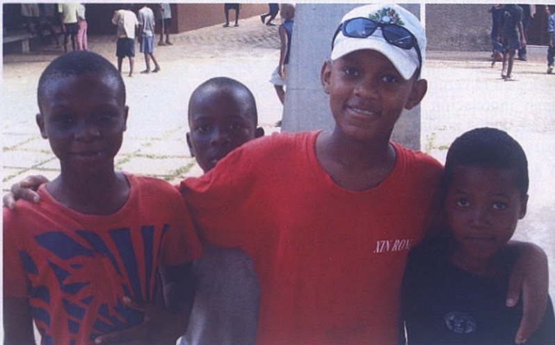
Niños en el patio del hogar salesiano

¡Mozambique sorprende!. Por mucho que uno se prepare y vaya con la idea de que se va a encontrar una manera diferente de vivir, al llegar allí sorprende la crudeza de la pobreza: cuando hueles a los chicos, los ves, se te marean en clase porque no han desayunado... Cuando esa realidad tiene rostro es una cosa diferente. Y segundo, sorprende la gente, por la manera de afrontar la situación, ciertamente en claves diferentes a las nuestras. Dios me ofreció una oportunidad muy rica al visitar Mozambique.