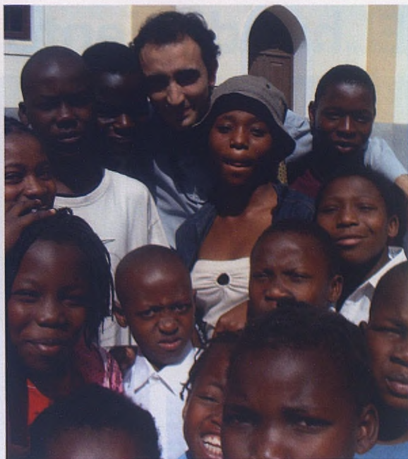
El misionero es muy querido entre los jóvenes

Para los que están formados sí. Lo que pasa es que los que están formados son una minoría. La mayor parte se emplea en el comercio informal, en la venta ambulante: Compras una caja de naranjas y des-