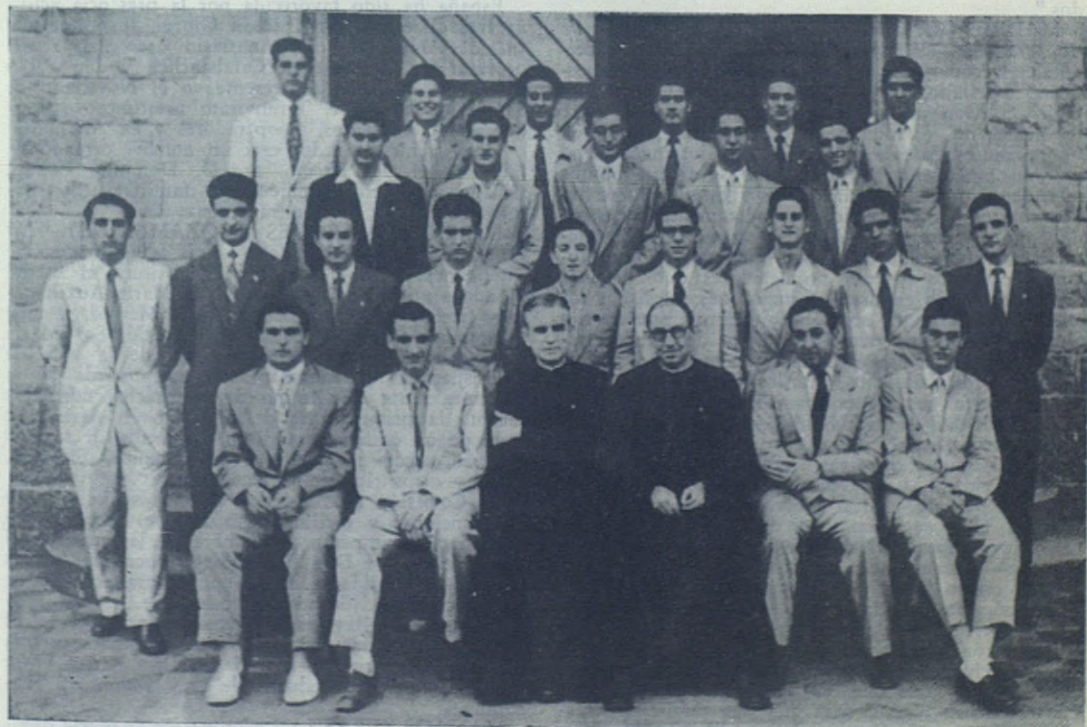
VALENCIA. — Jóvenes que, terminado su bachillerato, han constituido la Compañía de María Inmaculada

“La concebimos y la hemos desarrollado para una capacidad de cien alumnos, y consta, como veis, de esta nave en forma de “L” para las clases teóricas,