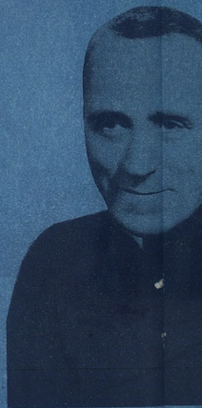
El Rvmo. don Renato Ziggiotti, V. Bosco, Rector Mayor de la Congregación Salesiana.

Las Escuelas Profesionales constituyen hoy día una de las más honradas preocupaciones de los Gobiernos y de cuantos tratan de la educación de la juventud. Muchos jóvenes se ven obligados a frecuentar las escuelas clásicas y técnicas, porque en muchos países no hay bastantes y buenas escuelas para la formación de obreros. Desde que el niño