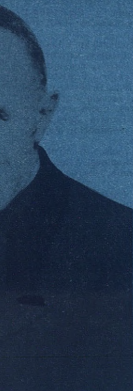
Y sucesor de San Juan Congregación Salesiana

asta que está en condicio- as corre un tiempo sobra- ar en irse formando orde- s de un laborioso apreñ- la instrucción cultural co- s que cuentan con dotación esianos y las Hijas de Ma- han ido venciendo —lenta- s de un laborioso apreñ- oven obrero, tratan de per- de multiplicar sus maes- la altura de la industria alestra de virtudes cristia- bien capacitada en su ofi- stos, tiempo y grandes sa- ortancia y complejidad del