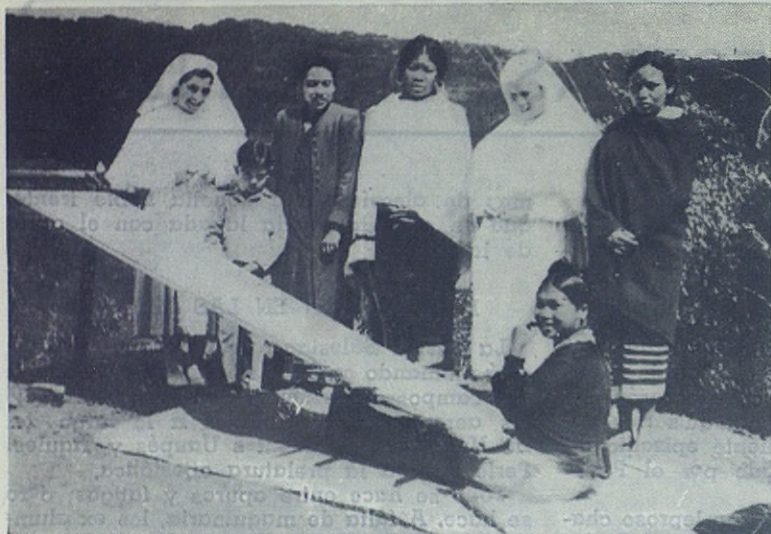
ASSAM (India). — Religiosas españolas, «Misioneras de Cristo Jesús», valiosas auxiliares de los misioneros salesianos en su apostolado entre las tribus Nagas. Estas pertenecen al hospital de Kohima