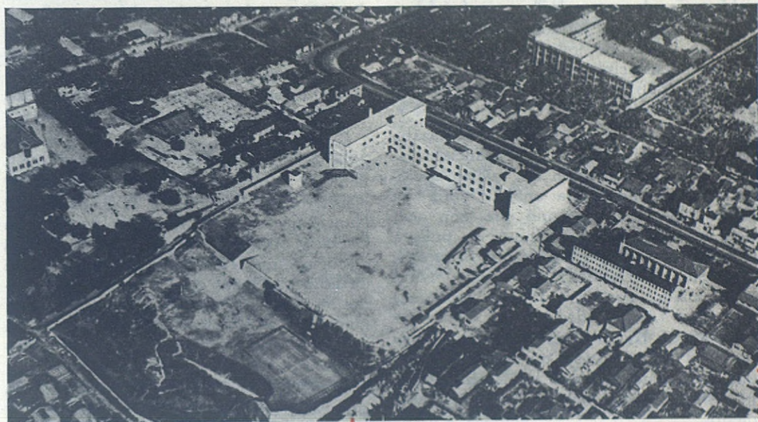
OSAKA.—Vista aérea del Colegio Salesiano que se yergue en lo alto de la «Colina del Sol Vespertino» sobre los terrenos de un antiguo templo budista.

La compra de aquel terreno no fué cosa fácil. Los propietarios eran más de cincuenta y para colmo en el centro se hallaban las ruinas de un templo budista, con su respectivo cementerio. El templo fué lo que más pasos nos hizo dar y ofreció mayores dificultades, tanto más que los fieles se habían decidido a reconstruirlo. Ante