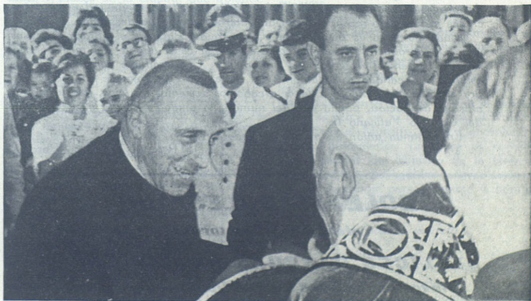
CASTELGANDOLFO.—S. S. Juan XXIII se entretiene afablemente con el Rector Mayor, recién regresado de América, en la Parroquia Salesiana de Castelgandolfo, residencia veraniega del Papa. Los feligreses contemplan sonrientes, muestra de su cariño a ambos personajes, la simpática escena.

Pero en estos momentos de lo que quiero hablaros es del felicísimo encuentro con el Sumo Pontífice, como broche providencial de las Fiestas Centenarias salesianas y de mis visitas al mundo salesiano.