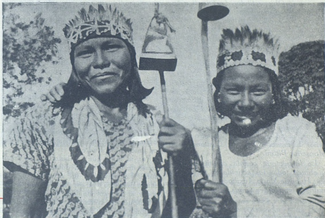
PUERTO PINASCO.—Jóvenes indias ataviadas con su mejor traje y su bastón de campanillas en espera del Rector Mayor. La cosa no es para menos. Los indios del Chaco Paraguayo han ofrecido al Rector Mayor sus mejores números de folklore y su amor y devoción a Don Bosco.

DE Puerto Guarani en dos horas de navegación llega a Fuerte Olimpo , la última etapa de su viaje en Paraguay. Fuerte Olimpo es la sede episcopal de nuestro Vicariato a cuyo frente se halla el Obispo Salesiano Monseñor Muzzolón. Al arribo de la lancha que conduce al Rector Mayor toda la población, con el Obispo al frente, está en los muelles esperándole. Monseñor le da la bienvenida en nombre de todo el Vicariato y Don Ziggotti le manifiesta su