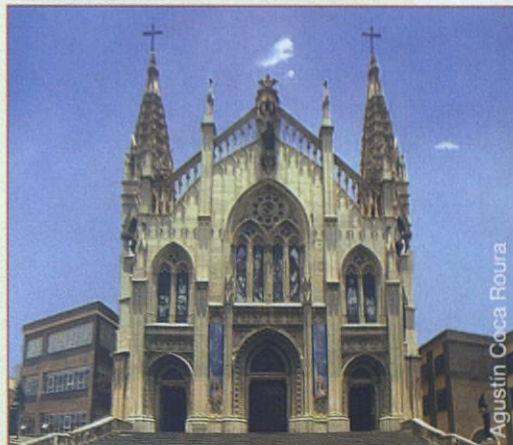
Agustín Coca Roura