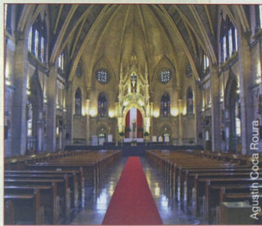
Agustín Coca Roura