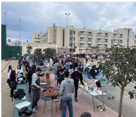
Burriana celebró con una gran comida el día de Don Bosco.