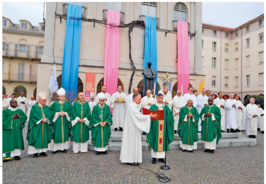
Acto de inauguración del Capítulo General 29 en Valdocco