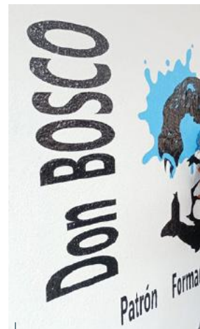
Los alumnos de Formación Profesional crearon un mural por el día de Don Bosco.