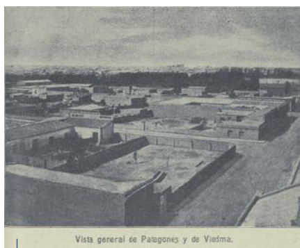
Vista general de Patagonia y de Viedma.

La publicación anual de esta carta en el Boletín Salesiano no solo permitió difundir los logros y avances de la congregación, sino que también fortaleció el sentido de pertenencia y compromiso entre los Cooperadores. Esta tradición, heredada desde los tiempos de Don Bosco, se convirtió en un medio eficaz para consolidar la unidad de la familia salesiana, brindar orientación espiritual y reforzar la identidad salesiana entre los Cooperadores. Además, estas misivas anuales fueron clave para mantener informados y activos a benefactores y colaboradores, alentándolos a continuar apoyando las iniciativas salesianas en todo el mundo.