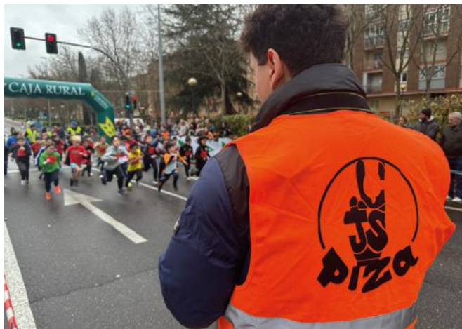
Salamanca: El Centro Juvenil Salesianos Pizarrales y el Colegio Salesiano 'San José' de Salamanca organizaron su tradicional carrera.