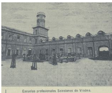
Escuelas profesionales Salesianas de Viedma.

Boletín Salesiano, junio 1899, página 13.