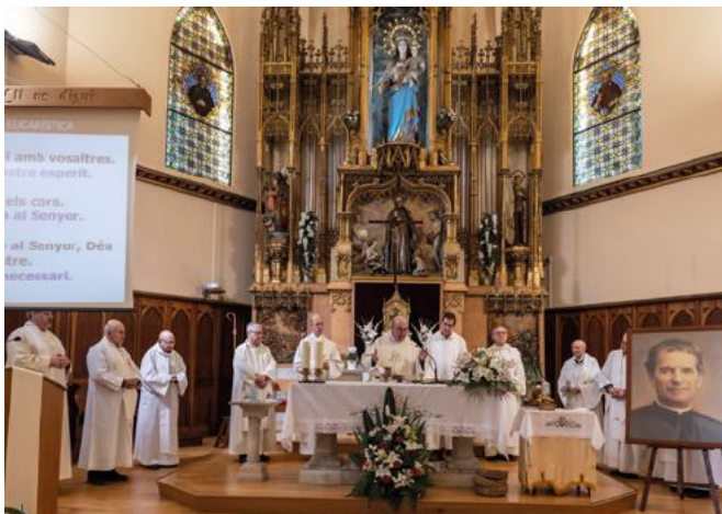
Ciudadella: Salesianos Ciudadella celebró una misa en honor a Don Bosco.