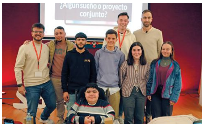
Jóvenes de distintos ambientes salesianos que protagonizaron la mesa redonda sobre la presencia en redes sociales.