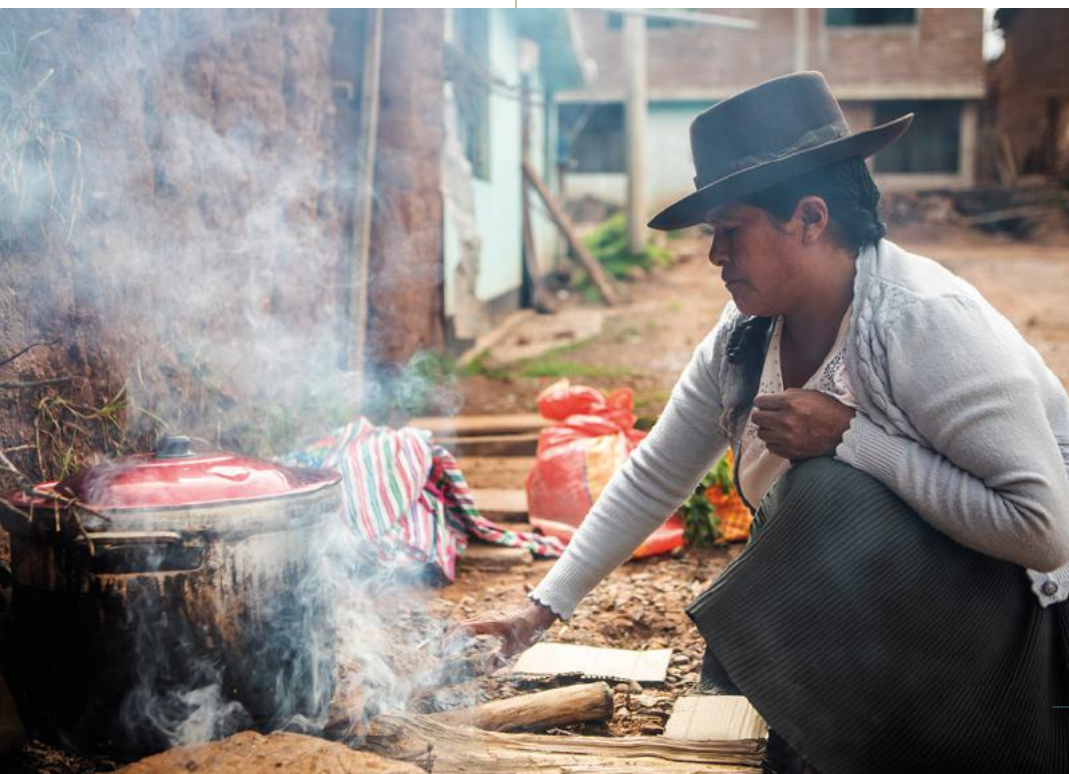
Una mujer en Latinoamérica prepara la comida en la calle.