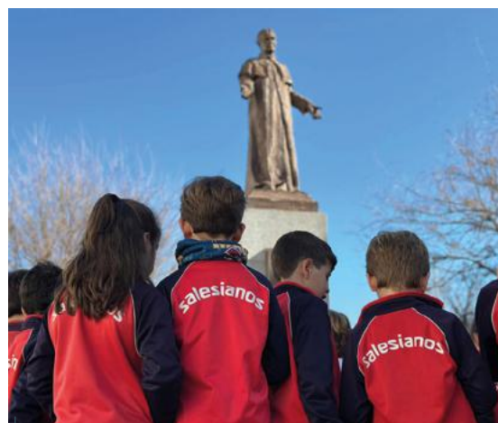
Las clases de Salesianos Córdoba visitaron el monumento de Don Bosco.