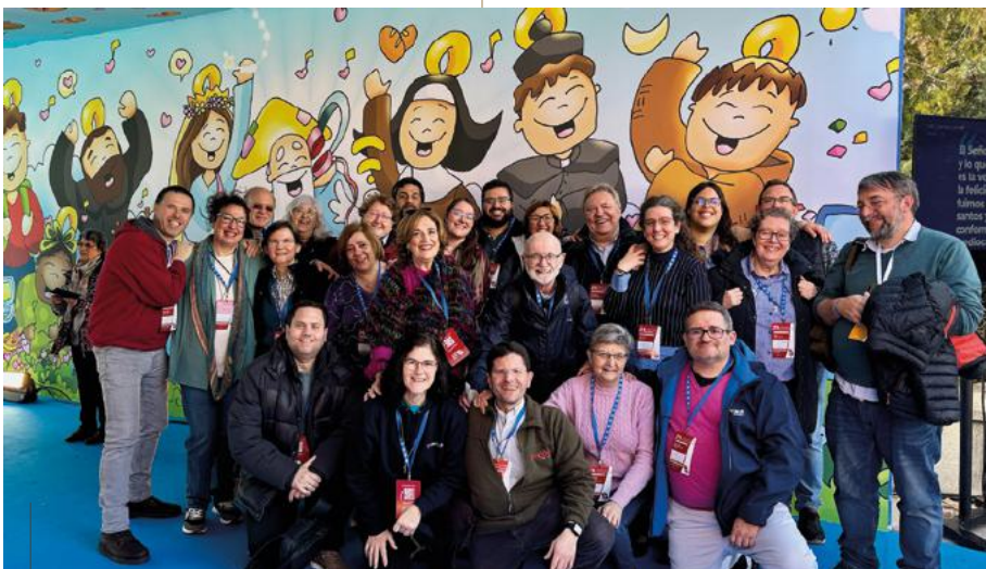
Grupo de representantes de Salesianos en el Congreso Nacional de Vocaciones en Madrid

Me pareció percibir, entre los participantes, un chute de esperanza en los momentos actuales. No dejo de percibir una nueva realidad eclesial que está brotando. Una mayor conciencia de lo que somos, una mayor claridad de las propuestas que hacemos, un ánimo más esperanzado, aún en medio de las dificultades, en el porvenir. ¿Algo nuevo está brotando?