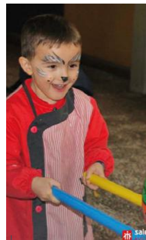
Los juegos y los pintacaras son parte de las celebraciones de los alumnos.