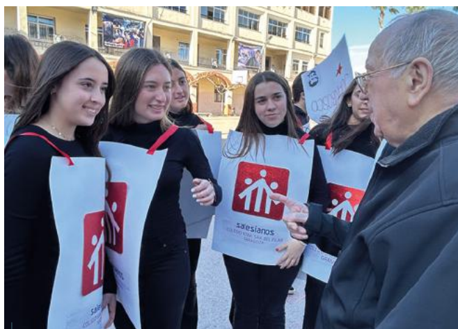
Zaragoza: Las alumnas de Salesianos Zaragoza se disfrazaron por la fiesta de Don Bosco.