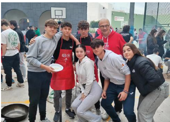
Villena: El patio de Salesianos Villena se llenó de personas que cocinaron para celebrar al fundador de los Salesianos.