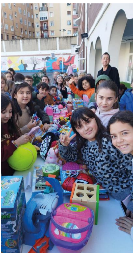
Los alumnos de primaria en el centro de Barakaldo salieron al patio para celebrar la fiesta de Don Bosco.