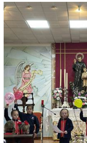
El colegio de Carmona celebra la festividad del fundador de Salesianos.