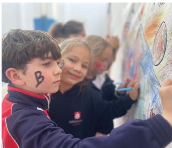
Los más pequeños de centro de La Cuesta pintaron un mural con el logo de Salesianos.