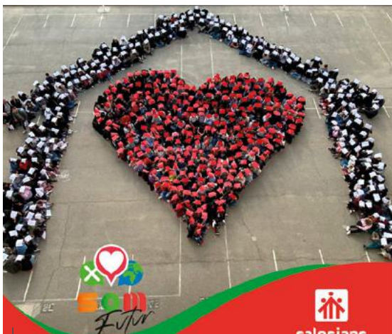
El centro de Sant Boi creó un collage gigante. "Somos casa con corazón".