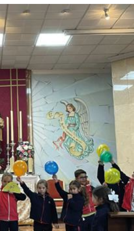
Se celebró un Triduo por la de los Salesianos.