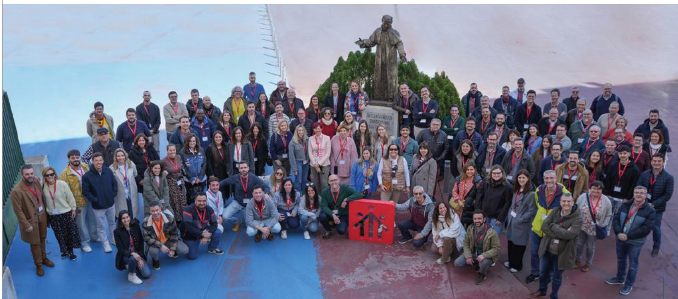
Asistentes a la XI Jornada de Comunicación en la sede inspectorial de María Auxiliadora