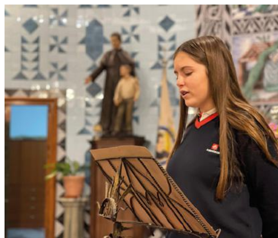
La casa de Úbeda celebró una misa con los alumnos del colegio en honor al santo de los jóvenes.