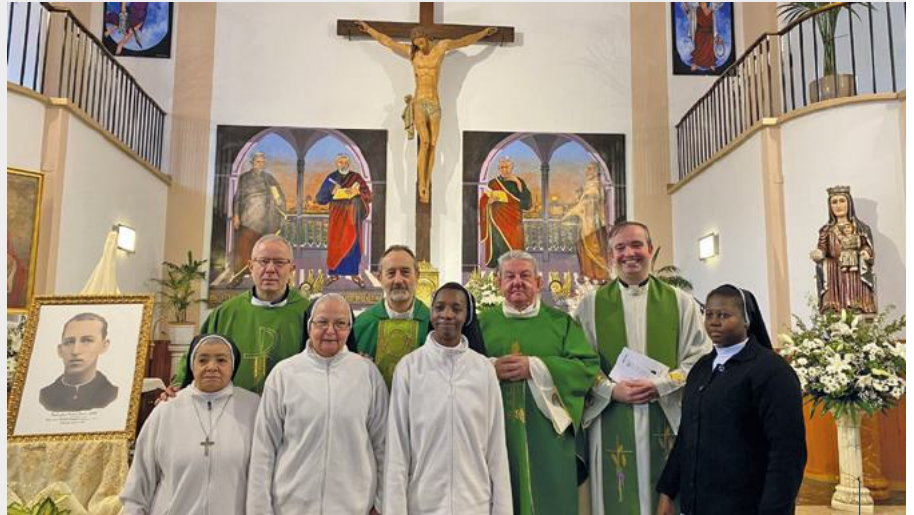
Un momento en las Jornadas de Espiritualidad de la Familia Salesiana en Turín-Valdocco.