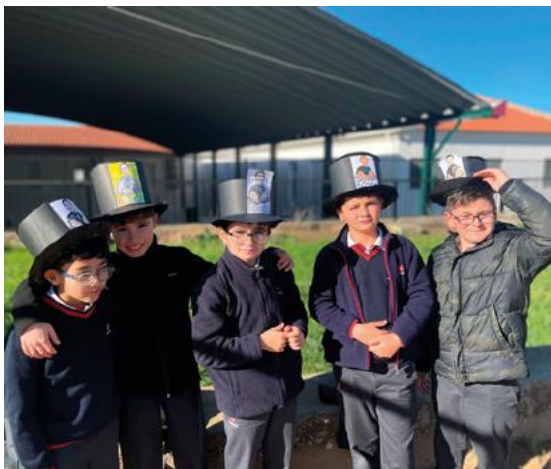
Los alumnos de Salesianos Mérida crearon sombreros de Don Bosco.