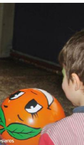
no faltaron en las de infantil en Avilés.