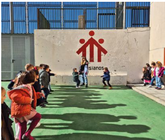
El colegio Domingo Savio de Madrid se llenó de risas durante el juego del pañuelo.