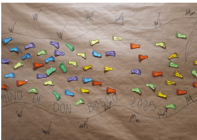
Valladolid: Los alumnos de Valladolid crearon un mural motivador con huellas.