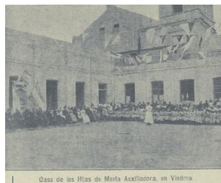
Casa de las Hijas de María Auxiliadora, en Viedma.

Boletín Salesiano, junio 1899, página 15.