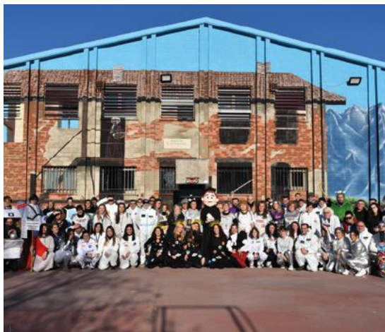
Todo el centro de Soto del Real se disfrazó de la temática 'Somos Futuro'.