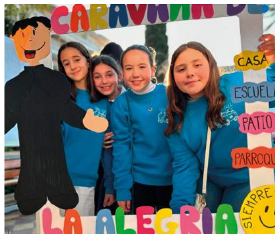
Morón preparó una Caravana de la alegría salesiana.