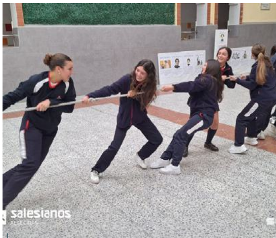
Las alumnas de Algeciras disfrutaron uno de los juegos más característicos de Salesianos.