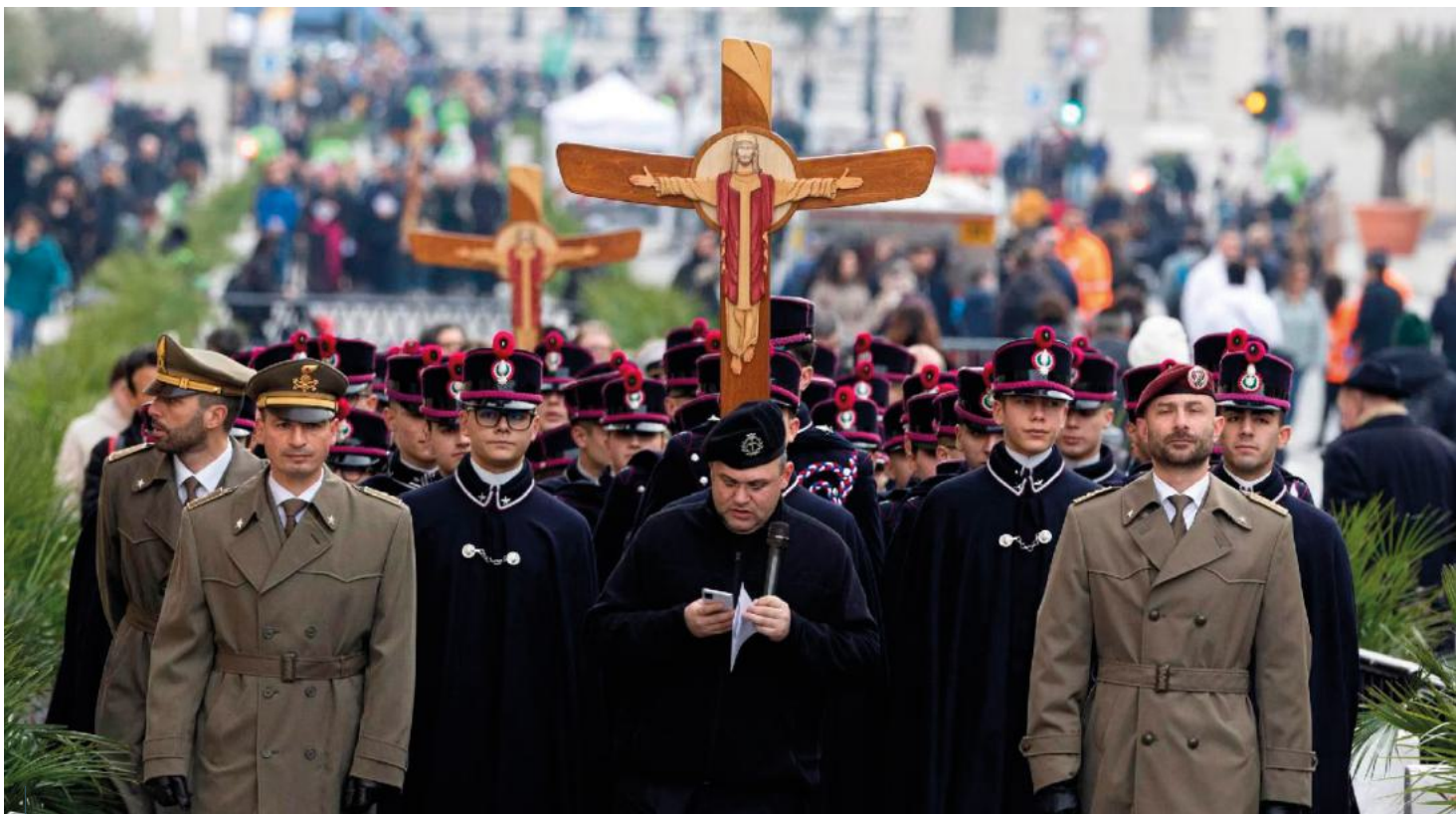
Representantes de las fuerzas armadas peregrinan hasta la basílica de San Pedro.

cadores a no ceder a la tentación de la superficialidad y la desinformación, reafirmando que la misión del periodismo debe estar siempre guiada por la búsqueda de la verdad y la justicia. De hecho, para evitar la “putrefacción cerebral” causada por “la dependencia del scrolling constante en las redes sociales”, Francisco subrayó que “necesitamos una alfabetización mediática, para educarnos y educar al pensamiento crítico, a la paciencia del discernimiento necesario para el conocimiento”.