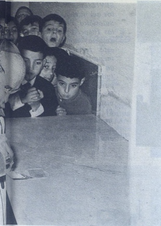
Alcalación de las reliquias de los mártires e multitud expectante y curiosa de los alum- ceremonia fue ejemplar.