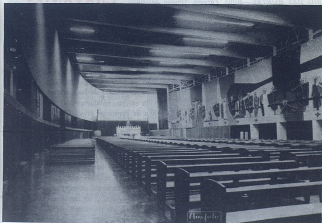
GUATEMALA. —Templo Nacional Expiatorio. El interior está construido de tal manera que desde todos los puntos puede verse el altar mayor. Mide 85 metros de largo y 35 de ancho. Es notable el Via Crucis. Los Salesianos harán de él instrumento para sostenimiento de la fe cristiana y aumento del amor a Cristo en Guatemala.

No cabe duda que, en esta hora sombría por la que está pasando la América hispana, el templo del Corazón de Jesús será un baluarte que defenderá la fe y las costumbres cristianas de los asaltos del comunismo y protestantismo.