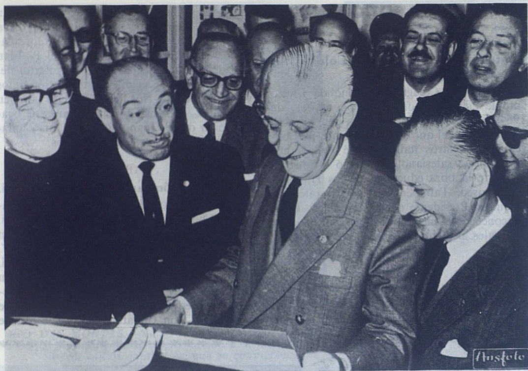
BUENOS AIRES. —El nuevo presidente argentino, Dr. Illia, que cursó sus estudios de bachillerato en el Colegio Salesiano Pío IX de Buenos Aires, volvió a visitar su colegio el día 6 de octubre, invitado especialmente para inaugurar quince aulas escolásticas y dos talleres de electrónica. Fue recibido con entusiasmo y cordialidad por los alumnos actuales y los antiguos alumnos. Con ellos y los salesianos departió amablemente, yéndose muy complacido de la visita. En nuestra foto, el presidente de la Argentina, rodeado de la Junta de la Asociación de Antiguos Alumnos salesianos.

en los ambientes salesianos, arribó al Japón en 1925. Posee las láurea de Filosofía y Matemáticas, pero su fama, largamente difundida en el Japón, se debe a la música; su obra "La señora Gracia de Hosokawa" se ha representado muchas veces, y él ha dado más de tres mil conciertos. Actualmente se halla bastante enfermo, por lo que la imposición de la condecoración hubo de hacerse en su propia habitación.