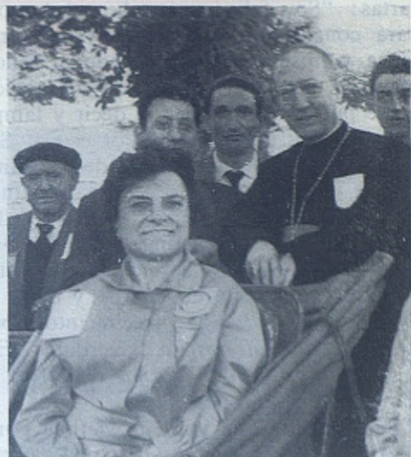
En su cochecito de inválida acudió a Lourdes en 1961, con la peregrinación presidida por el Obispo Auxiliar, Monseñor La Higuera.

Sus dolores y achaques la retiraron de la escuela y fueron reduciendo su actividad externa. Tres años antes de su muerte, no pudiendo ya valerse por sí misma, donó toda