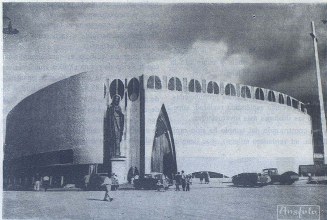
GUATEMALA.—Aspecto exterior del nuevo Templo Nacional Expiatorio, dedicado al Corazón de Jesús en esta capital. Es obra de los Salesianos. La imagen del Salvador que aparece en la fachada es de bronce y mide nueve metros de altura. El templo da la impresión de ser una enorme embarcación y simboliza la barca, que es la Iglesia.