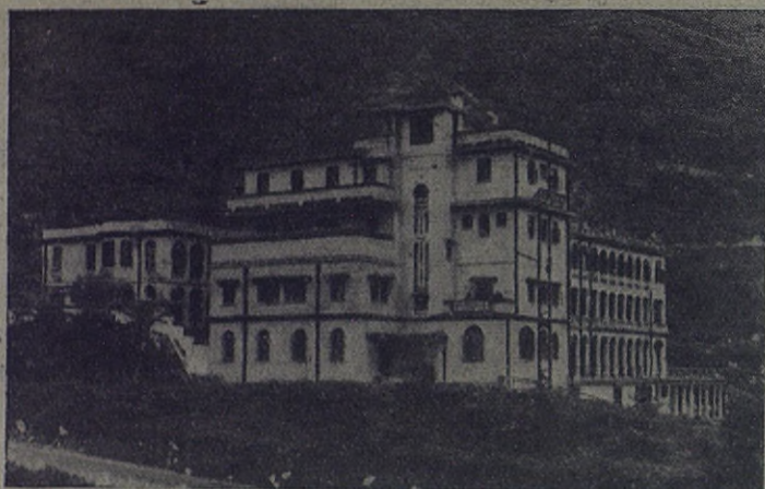
CHINA.—Casa Salesiana de San Kian, donde se alojan los Nevados y los Estudiantes de Filosofía de la Inspectoría Salesiana de China y un buen número de huérfanos, que ahora, ciertamente, se verán aumentados considerablemente por la guerra

también encendiendo mil hogueras bajo la furiosa acción de los bombardeos. En nuestra Casa había varios bidones de gasolina. ¿Qué hacer?... Tan peligroso era conservarlos como deshacerse de ellos perteneciendo al Ejército. Me abandoné en manos de María Auxiliadora, a la cual nos consagramos todos y cada uno de nosotros.