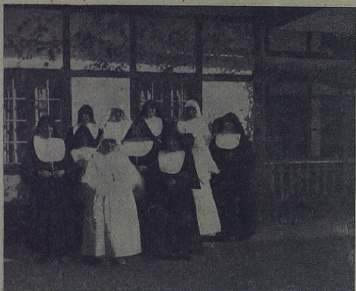
Un grupo de abnegadas misioneras, Hijas de María Auxiliadora, que trabajan con gran celo en la Misión Salesiana del Assam (India)

son más numerosos los niños que acuden a nuestra caridad. ¡Y pensar que quedan tantísimos abandonados! Las autoridades civiles y religiosas han afirmado que sólo nosotros en Kokubungi y las Hijas de María Auxiliadora en Akabané resolvemos satisfactoriamente el problema de la juventud pobre y abandonada. No hacemos en esto sino seguir las enseñanzas de Don Bosco y las normas tradicionales de nuestra Congregación, pareciéndonos la cosa más natural lo que otros creen una maravilla.