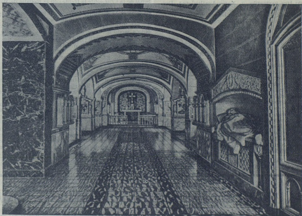
LA BASILICA DE MARIA AUXILIADORA, en Turín