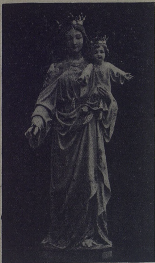
La hermosa estatua de María Auxiliadora de El Bosque (Cádiz)