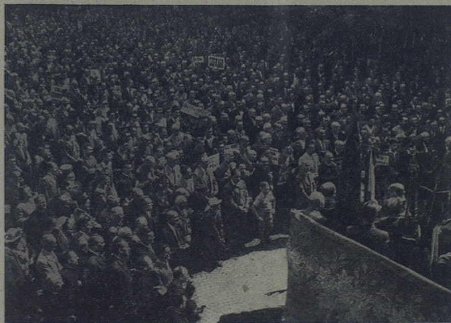
Imponente aspecto que ofrecía el patio del Oratorio de Valdocco (Turín) en la concentración de Antiguos Alumnos Salesianos

bre en el homenaje misional que España tributará al Papa el pró- ximo 23 de octubre.