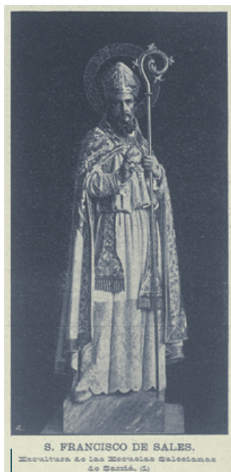
S. FRANCISCO DE SALES. Escultura de las Escuelas Salesianas de Sarría. (4)