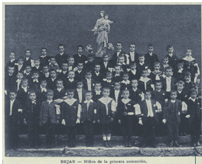
BEJAR — Niños de la primera comunión.

Boletín Salesiano, septiembre de 1911 (pág. 259).