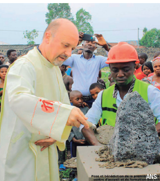
Pose et bénédiction de la première pierre du centre d'accueil et de formation des enfants.

GOMA (REPÚBLICA DEMOCRÁTICA DEL CONGO) ■ El Vicario General de la Congregación Salesiana, Stefano Martoglio, visitó la Inspectoría África Central (AFC) en el