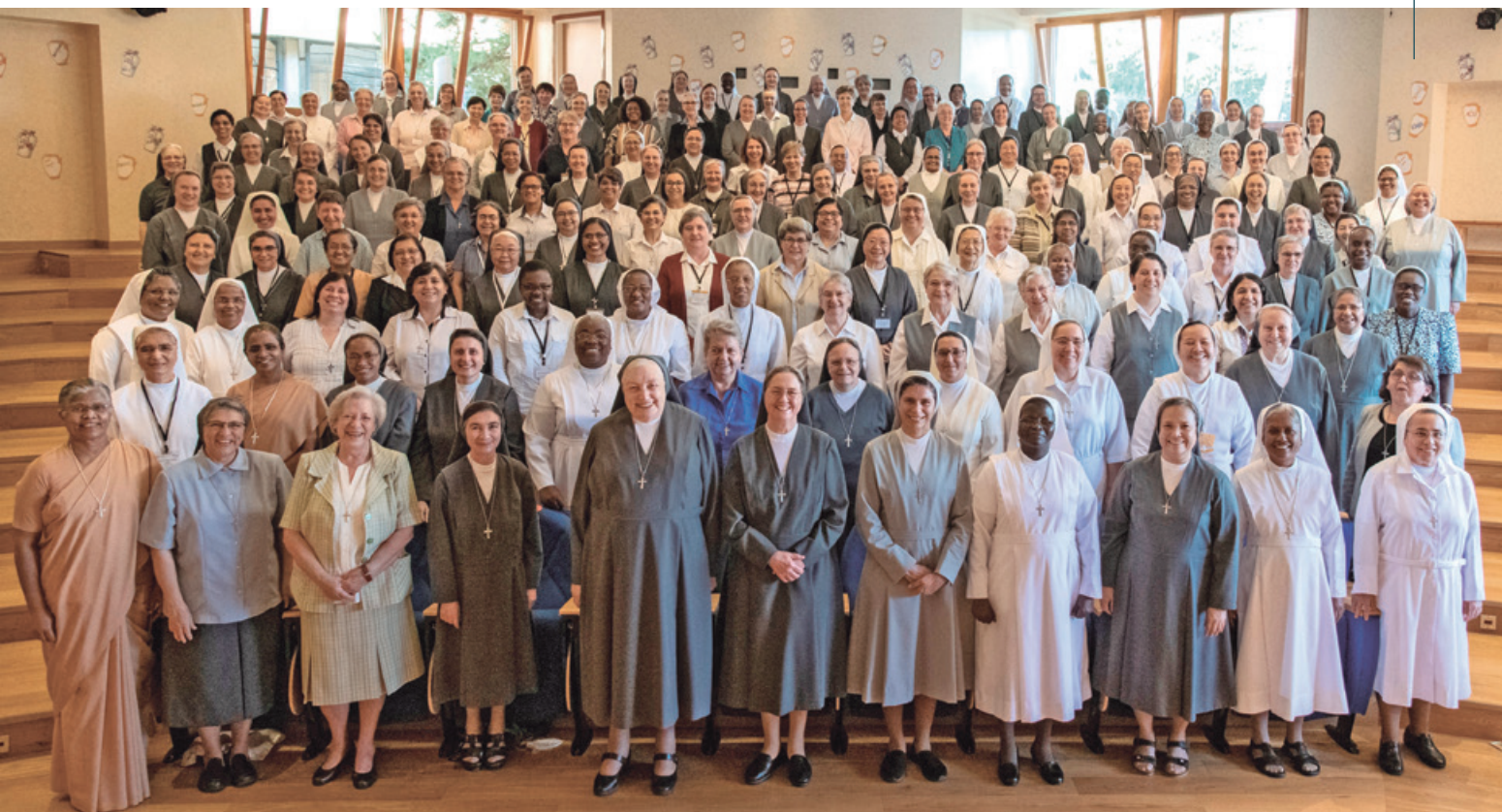
Grupo de las 172 capitulares que dieron forma al Capítulo General 24.

Recordamos lo expresado por nuestra Madre General, Sor Chiara Cazzuola, en las palabras conclusivas que dirigió a la asamblea capitular: "Como educadoras salesianas sabemos bien que para preparar el futuro y actuar procesos de cambio debemos cualificar cada vez más la formación y la misión educativa. El futuro de la humanidad y de la casa común dependen de esto. Es