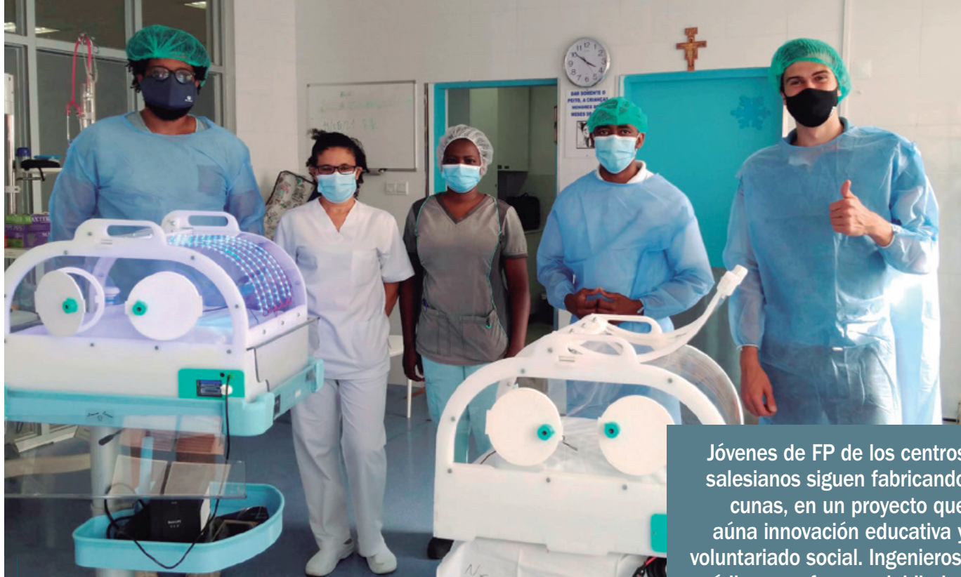
Dos cunas climatizadas instaladas en su destino.

Jóvenes de FP de los centros salesianos siguen fabricando cunas, en un proyecto que aúna innovación educativa y voluntariado social. Ingenieros, médicos, profesores, jubilados y alumnos se unen en un proyecto que habla de vida y solidaridad.