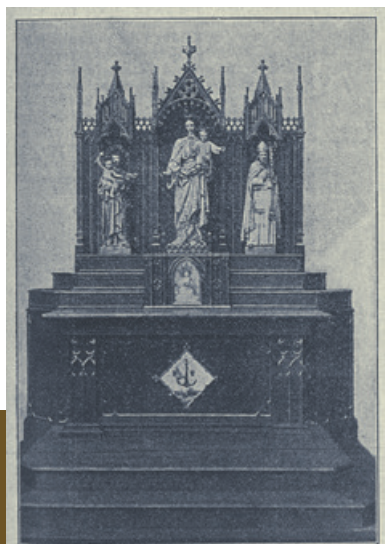
Altar é imágenes de la Capilla Salesiana de Béjar. (Obra de las Escuelas Profesionales de Sarría).

Más información en: https://boletinsalesianos.blogspot.com/