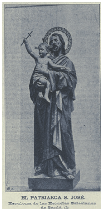
EL PATRIARCA S. JOSÉ. Escultura de las Escuelas Salesianas de Sarría. (4)