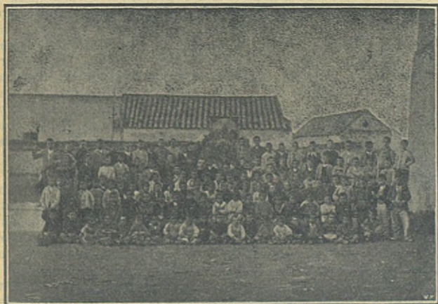
Alumnos de la Casa Salesiana de Ecija.

regenerarlos á la vida del espíritu mediante la predicación del Evangelio. El Salesiano lo abarca todo, el taller, la escuela y la granja, donde quiera que esté es todo para todos. No se contenta con desterrar la ignorancia en las escuelas, sino que también en las artes y oficios hace que los niños estén á la altura del día, y eso lo vemos en esa estatua que veneramos, obra de los talleres salesianos de Sarriá. Con el Evangelio llevan la ilustración á todas partes. De lo dicho, así concluía la tercera noche, queda demostrado hasta la evidencia lo que son los Salesianos. Los que antes estaban ciegos y no conocían á Dios, ahora lo conocen, los que antes estaban tullidos, hoy marchan por el camino de la virtud, los que antes ignoraban quien era Dios, hoy lo respetan y esto lo vemos con nuestros propios ojos en los niños que asisten á las escuelas salesianas de nuestra ciudad. Como era consecuente, exhortó al pueblo á que coadyuvara prestándole socorros materiales.