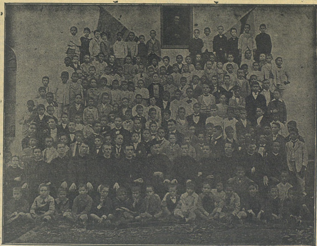
Superiores y alumnos de la Casa Salesiana de Valencia (Venezuela).