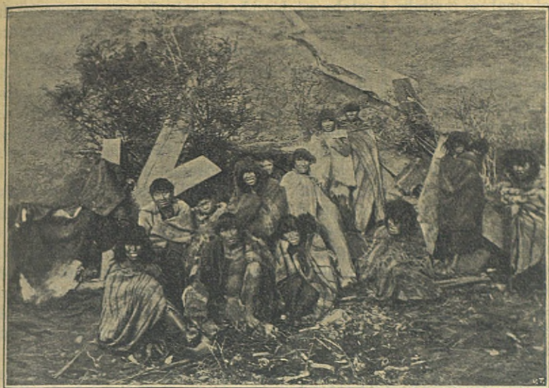
Indios Tobas del Chaco Paraguayo.