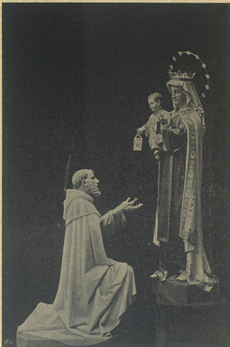
Aparición de Ntra. Sra. del Carmen al B. Stok.

rada convertida en santuario sin más adorno que un Crucifijo y una imagen de María Sma.: el agua de las fuentes era su bebida, hierbas y