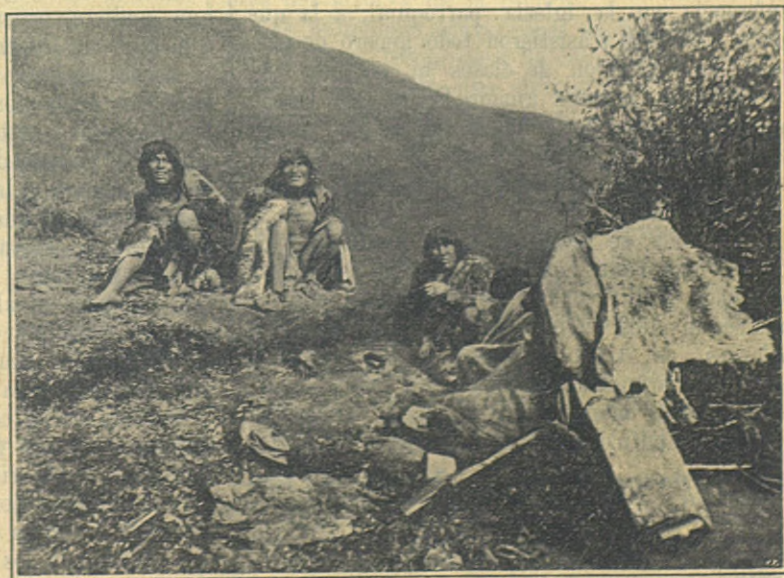
Indios Tobas del Chaco Paraguayo.