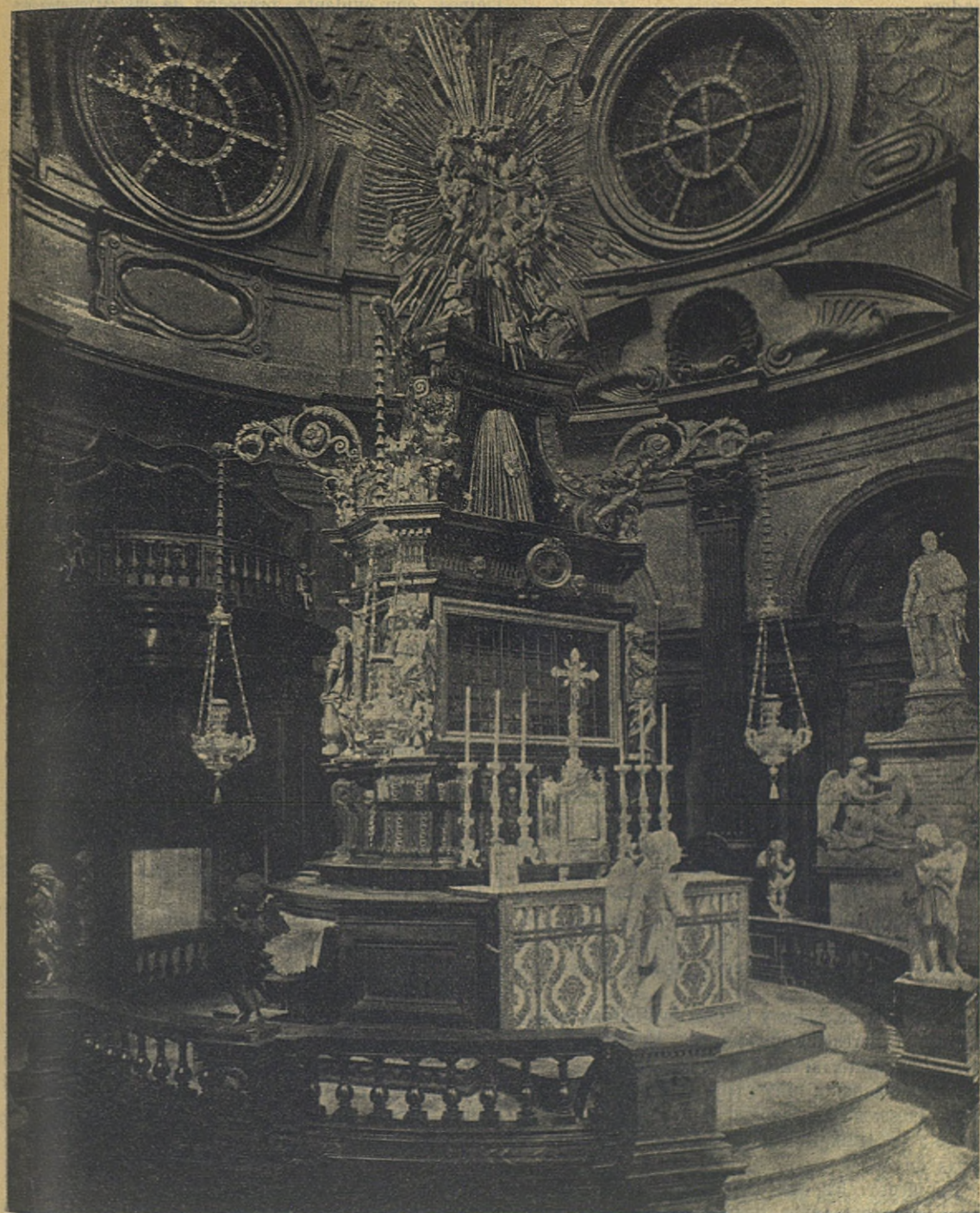
CAPILLA DE LA "SANTA SINDONE."