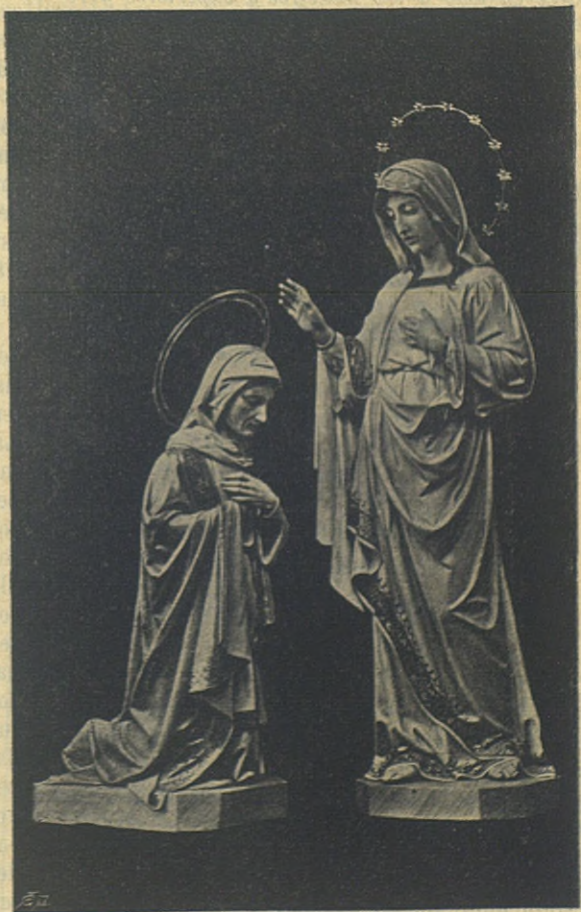
La Visitacion de Ntra. Sra. (2 de Julio.)

» Haces muy mal en creer que te olvido; el escribirte todos los días, como dices en tu última,