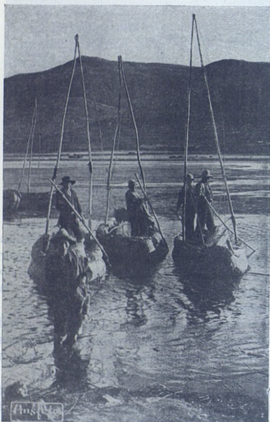
Pescadores del lago Titicaca sobre sus barcas trenzadas con mimbres y fibras vegetales.

PUNO.—A 3.800 m. de altura, en las orillas del pintoresco lago Titicaca, la ciudad de Puno tiene una población de 15.000 habitantes. Además de las riberas del Titicaca, el resto de la región es una de las más ricas del Perú y de las más fértiles (tierra negra), buena también para la cría de ganado. Una necesidad urgente de técnicos y la lucha contra el analfabetismo han inducido al Gobierno a crear un centro de estudios y de cultura para los indios.