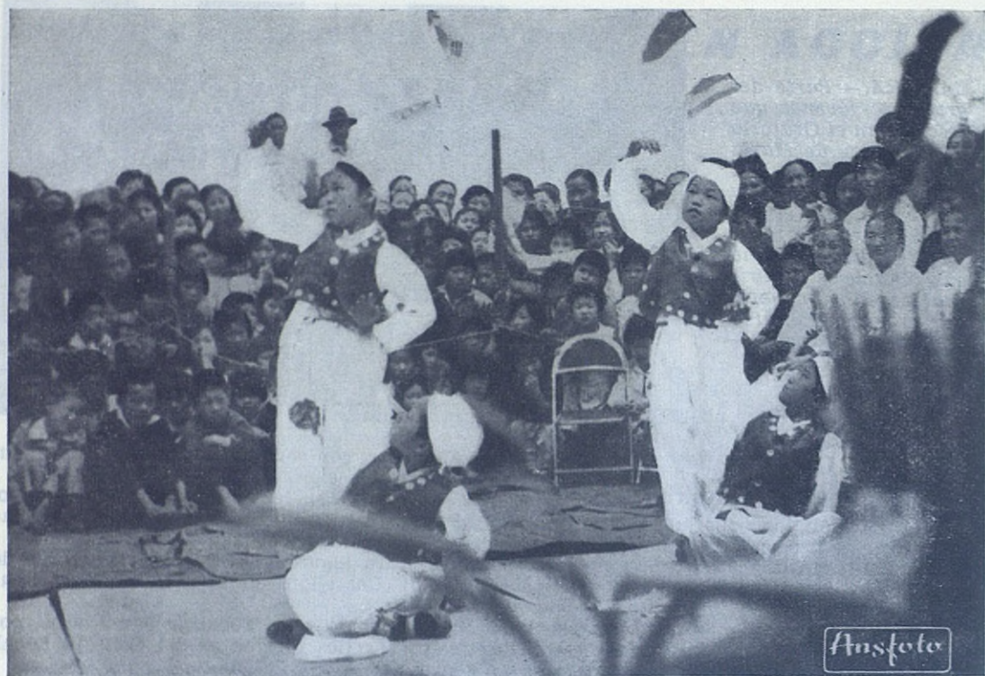
SEUL.—Niñas de la parroquia salesiana de San Juan Bosco en la capital coreana, danzando en la celebración de una fiesta religiosa.