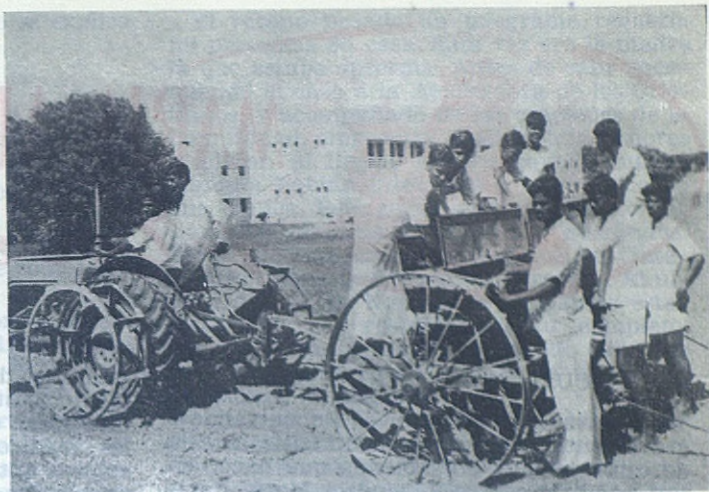
MADRAS.—En nuestro pasado número de mayo dimos una amplia crónica de la hacienda «Maria Auxiliadora», en la que el desierto se convirtió en campos de arroz y pinares para atender a centenares de muchachos y enseñarles al propio tiempo las técnicas agrícolas. Ahí vemos un grupo de esos muchachos examinando una máquina agrícola.