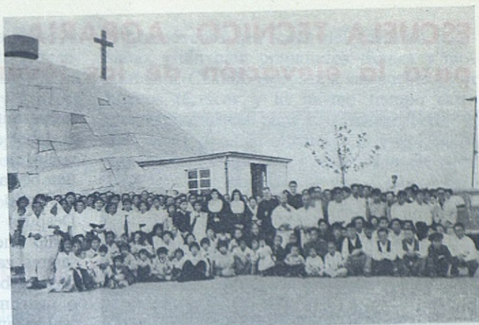
A 40 kilómetros de Kwanju existe un villorrio de 200 leprosos a los que atienden las Hijas de María Auxiliadora y los Salesianos.

Hace ahora cinco años que nos establecimos también en Seul, dedicados a la cura de almas en una parroquia, dedicada a San Juan Bosco desde hace veinte años.