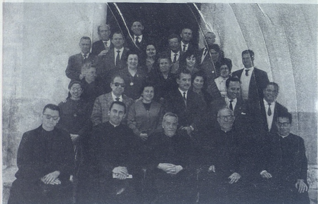
GODELLETA.—Cooperadores que celebraron el primer día de retiro espiritual.