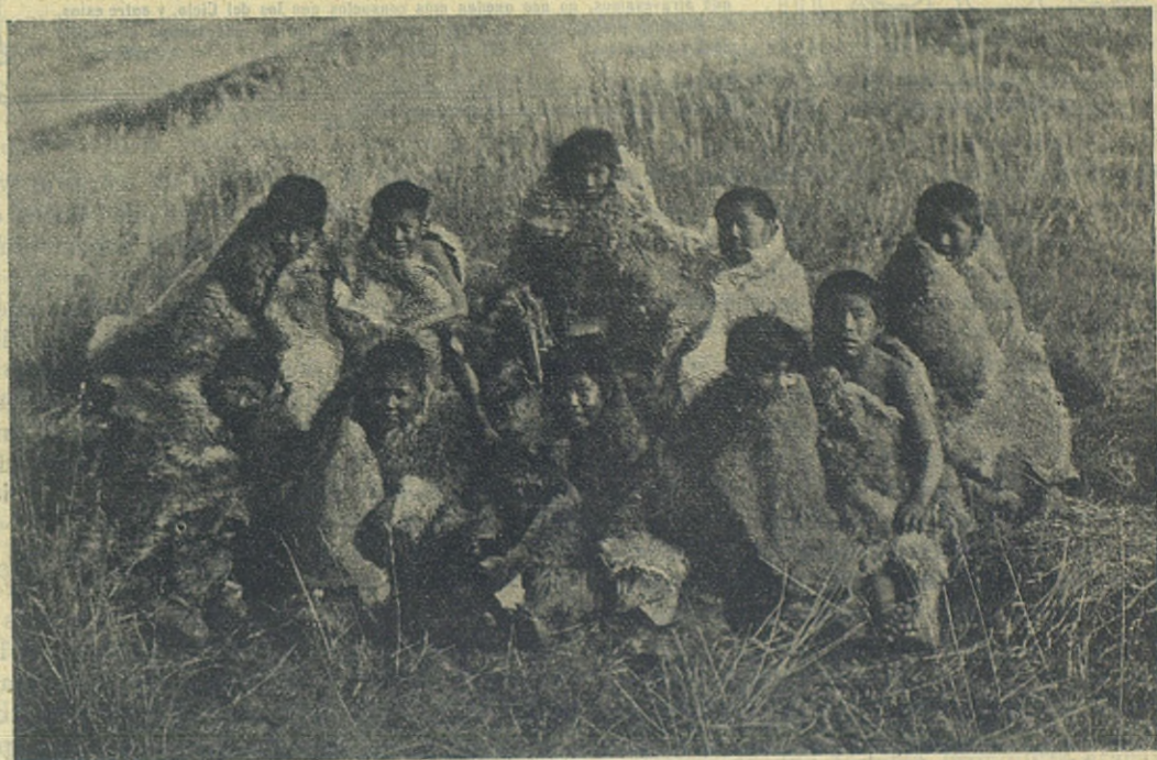
Fueguinos de la Misión de Río Grande.

Los Cooperadores Salesianos que confesados y comulgados , visiten devotamente una iglesia o capilla pública, o si viven en comunidad, la propia capilla, y rueguen según la intención del Sumo Pontífice, pueden ganar las siguientes indulgencias plenarias: