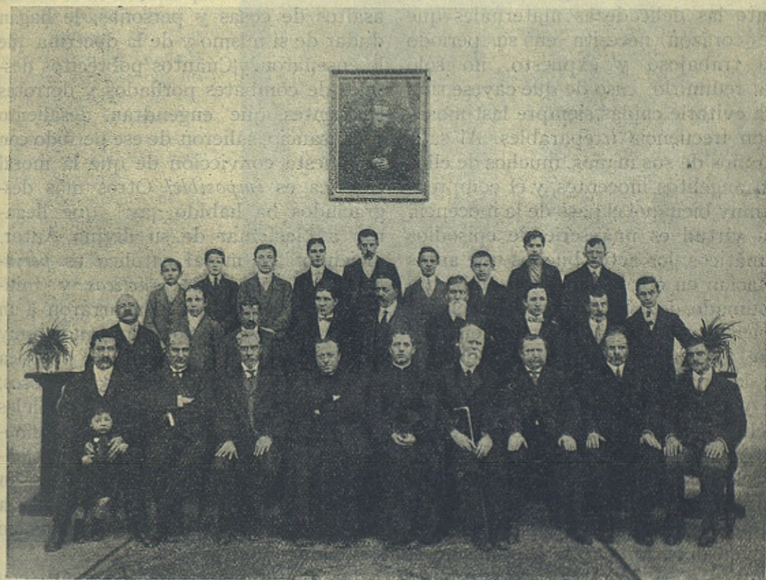
BERNAL — Antiguos alumnos, Catequistas del Oratorio festivo.

grandes fines de nuestra existencia. El joven no confía entonces a nadie sus secretos; no quiere espectadores de esas luchas íntimas, porque contemplarían sus debilidades; ni desea tampoco testigos de esas discusiones que se entablan entre la obligación de creer y la necesidad de examinar: si la piedad arraigó en su alma, confiará de cuando al confesor los resul-