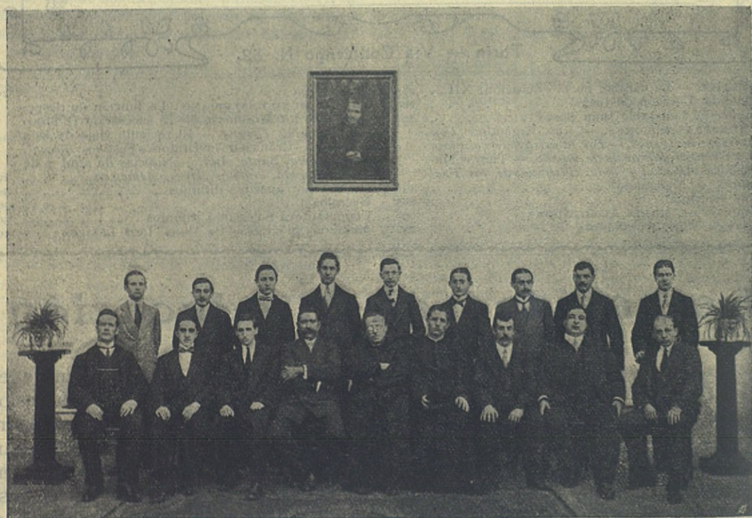
BERNAL — El cuerpo de Catequistas del Oratorio.

dres, aún cuando los hay, si no son muy lince, no advierten que en la adolescencia se fijan generalmente las máximas prácticas de la vida en todo orden de ideas; que no es una pasión, tan solo, como decíamos antes, la que asalta el corazón del joven, son todas a la vez: el amor y la ambición, la avaricia y el orgullo, la gula y la pereza, la vanidad y el egoísmo; que entonces comienzan esos diálogos misteriosos