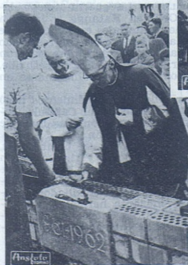
SUIZA. — Primera piedra del Aspirantado Salesiano.