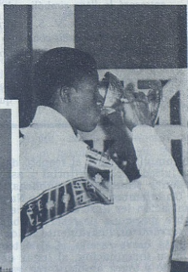
ELISABETHVILLE. — Mientras la guerra enluta el Congo, este novel Sacerdote Salesiano ofrece la hostia pacífica y el cáliz salvador.