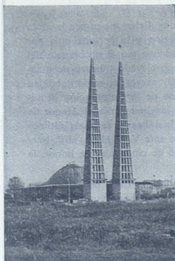
AUSBURGO. —Las airosas torres de la iglesia dedicada a San Juan Bosco acaban de ser terminadas. Miden setenta metros de altura.