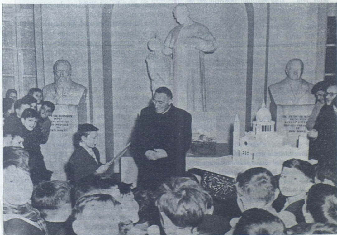
COLLE DON BOSCO. —Las obras del templo de Don Bosco han comenzado. El Rector Mayor no puede ocultar la ilusión que tiene puesta en ellas y con frecuencia se traslada para ver sus progresos, momentos que aprovechan los aspirantes del Colle para decirle que ellos también anhelan el momento de que la maqueta tan airosa y blanca se convierta en un templo de verdad, en el que ellos serán monaguillos, cantores y hasta, si se tercia, cicerones. De ello se encargarán los Cooperadores Salesianos.

Por el contrario, el «estalinismo» de que son objeto las estrellas del cine, del boxeo, del ciclismo, del fútbol, de la canción, etcétera, etc.... no tramonta nunca. Pasan los «divos» y las «estrellas» pero no el divismo, no tramonta esta herejía práctica, que