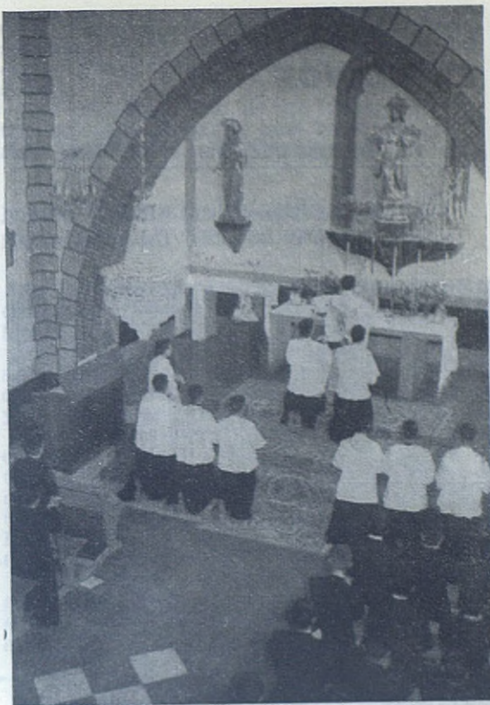
GODELLETA.—Capilla del nuevo Noviciado.

Ya lo sabéis, queridos lectores del BOLETÍN, sobre todo, vosotros los madrileños: En el Oratorio Santo Domingo Savio, de Hermanos García Noblejas, 66, de Madrid, hay centenares de niños, buenos y simpáticos, que piden por ustedes todos los días para que sean del número de sus bienhechores. Esta es una oportunidad que el Señor nos ofrece a todos de ayudar a San Juan Bosco a hacer de los niños pobres honrados ciudadanos y buenos cristianos.