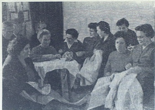
ALLARIZ (Orense).—Grupo de celosas Cooperadoras que semanalmente dedican una tarde para arreglar la ropa del centenar y medio de Aspirantes que se preparan para ser futuros Sacerdotes Salesianos.

Cooperadores les animó a seguir militando en esta Pia Unión de Cooperadores, tan grata a los Papas y a la Iglesia. A los nuevos seminaristas les animó a dar su nombre para que disfruten de los beneficios con que está enriquecida la Pia Unión de Coopera-