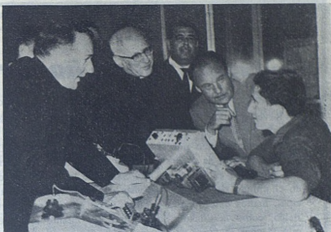
ROMA. — El Ministro de Trabajo inglés de visita en Ponte Mammolo.