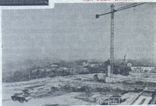
COLLE DON BOSCO. — Estado de las obras del templo a San Juan Bosco.