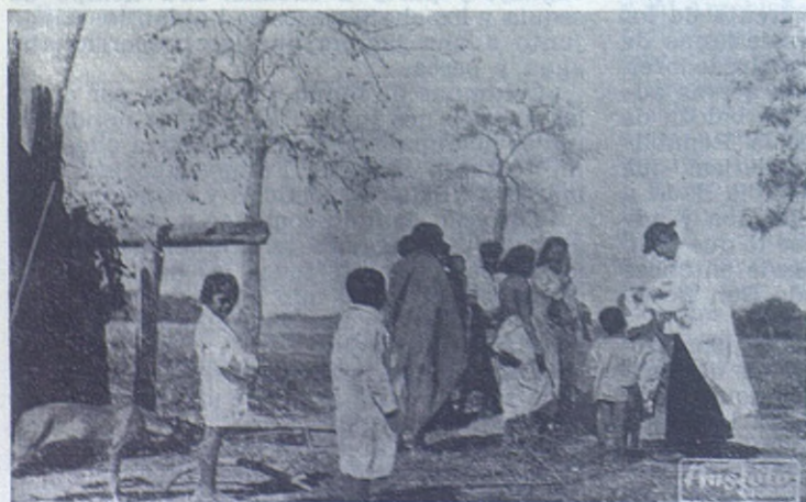
CHACO PARAGUAYO. — Tocó a Mons. Pittini abrir muchos de los caminos de América a los Salesianos: El Chaco, Santo Domingo, Boston... En el Chaco tuvo que empezar por una obra de misericordia, vestir al desnudo, como nos lo muestra la histórica foto.

—No se la señalaré yo, señor Presidente; ponga una mano en su corazón y otra en la bolsa y escuche lo que ambas le digan.